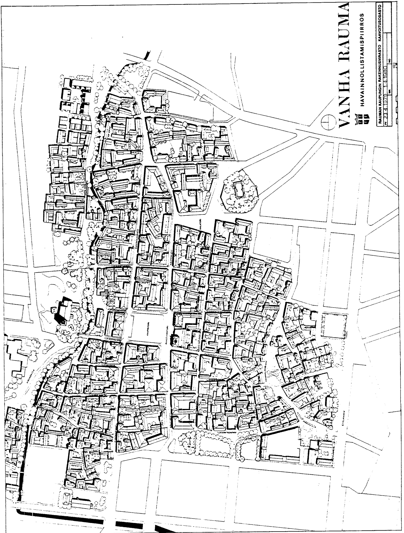
Rauma : plan de la vieille ville / map of the old town