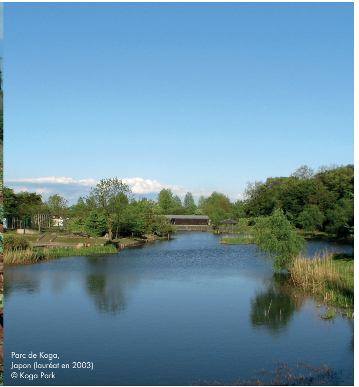
Parc de Koga, Japon (lauréat en 2003)