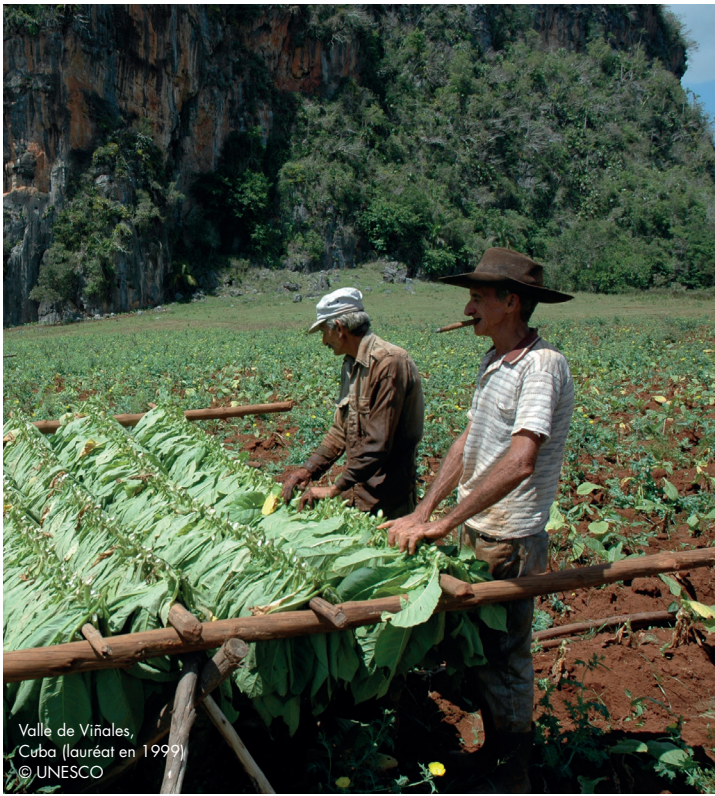
Valle de Viñales, Cuba (lauréat en 1999)