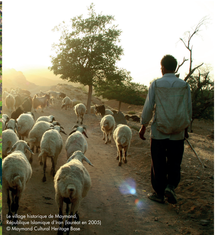
Le village historique de Maymand, République Islamique d'Iran (lauréat en 2005)