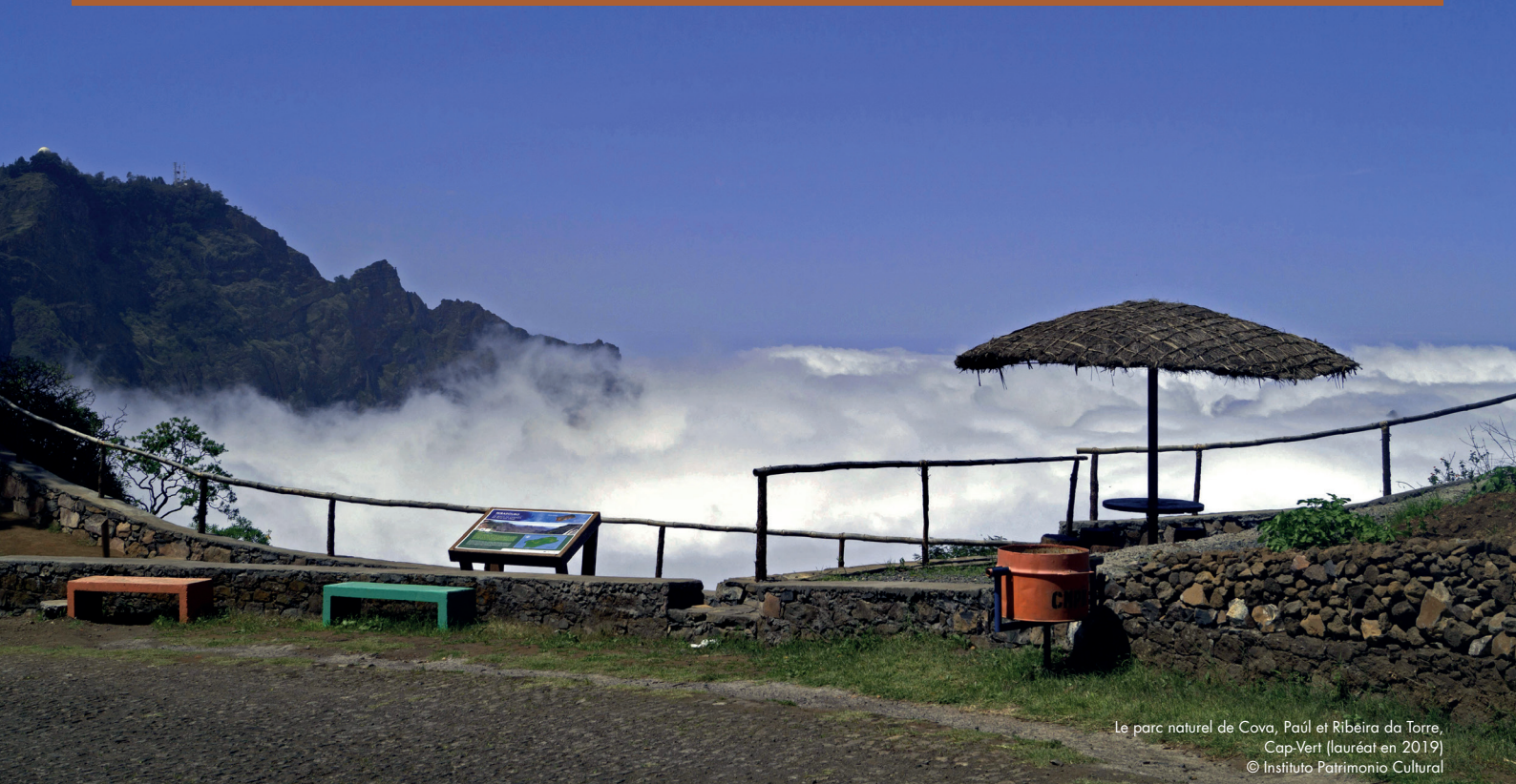
Le parc naturel de Cova, Paúl et Ribeira da Torre, Cap-Vert (lauréat en 2019)