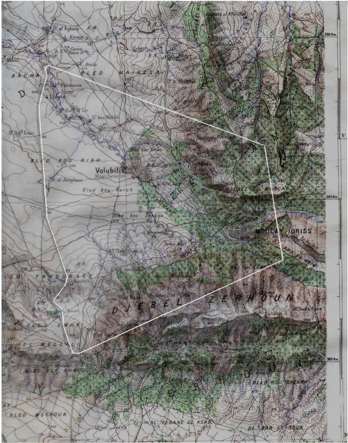
Extrait de la carte officielle de Moulay Idriss, Echelle : 1/50000 avec délimitation de la zone tampon telle qu'elle est définie par le dahir de 1920