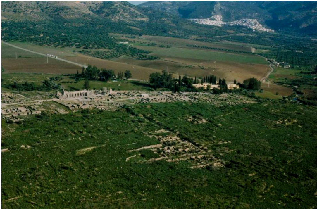
Volubilis au premier plan, la ville de Moulay Idriss et le massif du Zerhoun au second. Près du site, on voit les anciens locaux de l'administration qui masquer avec leur hauteur, la co-visibilité au sud-est des ruines