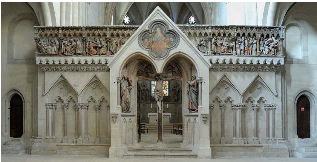
Le jubé ouest