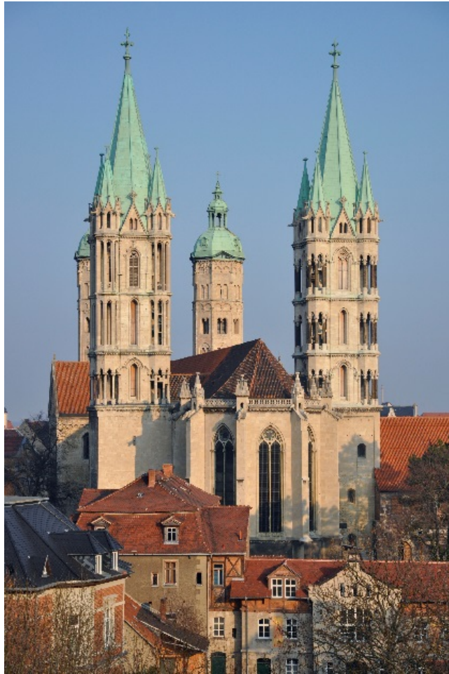
Cathédrale de Naumburg