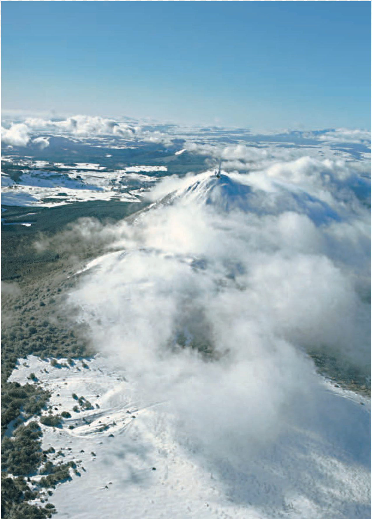
Vue du puy de Dôme depuis le nord