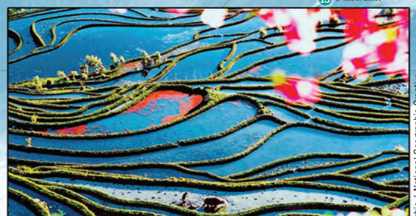
Les rizières en terrasses des Hani de Honghe s'entrelacent en motifs complexes bleus et verts au sein du mont Ailao dans le Yunnan, en Chine. Les agriculteurs ont créé cet environnement montagneux en harmonie avec la nature depuis 1 300 ans, cultivant du riz rouge, protégeant les forêts denses qui recueillent l'eau de pluie, et entretenant plus de 400 kilomètres de canaux.