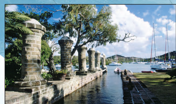
Les colonnes de pierre grise d'une volière s'élevaient encore au chantier naval de Nischan à Antigua (Antigua et Guatemala), où se rencontraient l'océan Atlantique et la mer des Caraïbes. Au XVI e siècle, des milliers d'esclaves aïno-cains travaillaient comme fabricants de voiles et charpentiers dans ce port protégé sur la côte sud de l'île. Le chantier naval approvisionnait la marine britannique dans les Caraïbes entre 1723 et 1850.