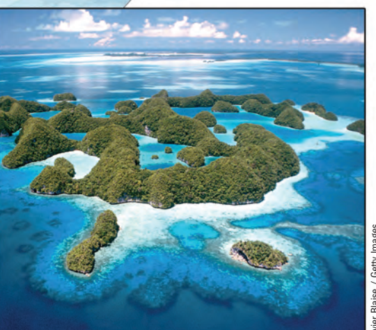
Avec 52 lacs marins - la plus grande concentration au monde - le Lagon sud des Îles Chulachabang de Palau offre un laboratoire permettant d'étudier des plantes et animaux uniques, parmi lesquels 385 espèces de coraux. Les sites lunaires révelent que les humains prospèrent parmi ces forêts et lagons peuplés plus de 3 000 ans.

Des vastes plaines du Serengeti à des villes historiques comme Vienne, Lima et Kyoto ; de l'art rupestre préhistorique de la péninsule Ibérique à la Statue de la Liberté ; de la Casbah d'Alger au Palais impérial de Beijing - tous ces lieux, dans leur diversité, ont un élément commun. Ce sont tous des sites du patrimoine mondial d'une valeur culturelle ou naturelle exceptionnelle pour l'humanité, et qui méritent d'être protégés pour permettre aux générations futures de les connaître et de les apprécier.