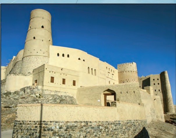
Les épais murs de pierres et de briques du fort de Bahia à Oman s'étendent sur 13 kilomètres, et sa tour centrale à plus de 50 mètres de hauteur. Le fort a été construit afin de protéger une oasis et un centre de commerce prospère qui devint la capitale de la tribu des Banu Nashan entre le XII e et le XV e siècles.