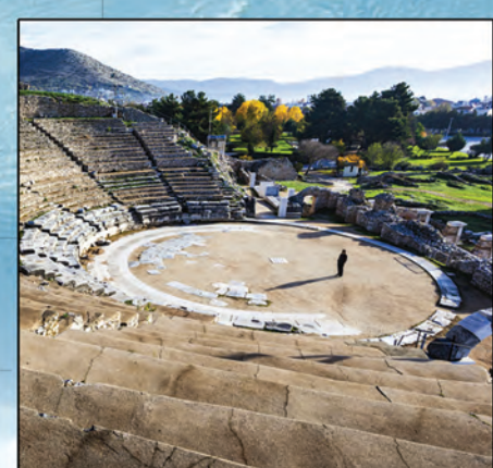
En Gaocheng, le roi macedonien Philippe II fonda Philippe II en 358 av. J.-C., érigant un grand théâtre et des fortifications. Deux cents ans plus tard, la ville devint un avant-poste de l'Empire romain, puis un centre de la nouvelle foi chrétienne au I er siècle apr. J.-C.