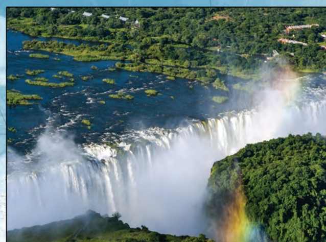
Aux Chutes Victoria ou Mosi-oa-Tunya (« la fumée qui gronde »), les grondements et les éclaboussures du fleuve Zambèze se projettent contre les gorges de basalte. À la frontière boisée entre le Zambie et le Zimbabwe, Bulime et arc-en-ciel s'étendent le long des deux kilomètres de chutes, qui atteignent une profondeur de 108 mètres.