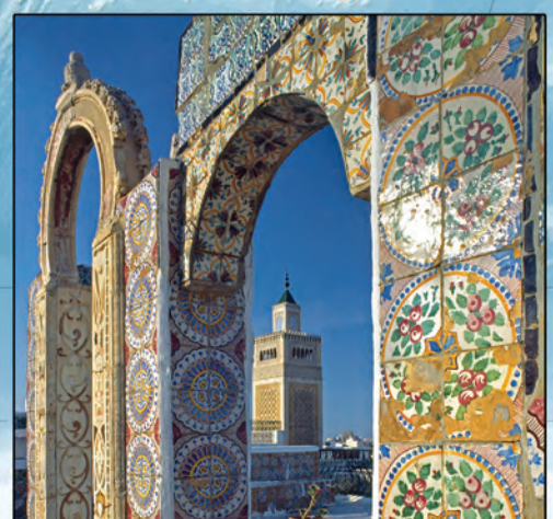
La Médina de Tunis englobait la mosquée restaurée d'Al-Zaytuna, fondée en 698 après J.-C. Quatre 700 palais, mosquées, mosquées et autres monuments construits entre le VII e et le XV e siècles préservent et honorent l'une des villes les plus spectaculaires d'Afrique du Nord.