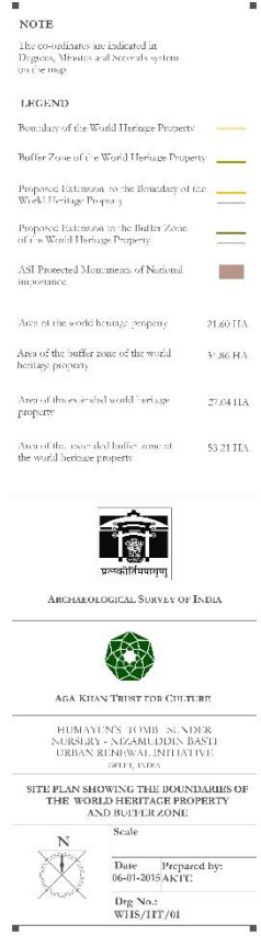
Plan indiquant les délimitations révisées du bien et de la zone tampon