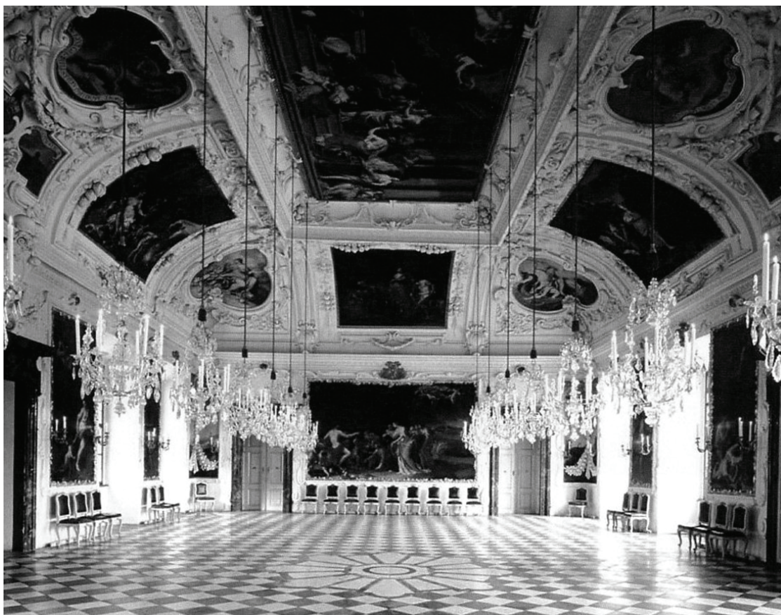
Salle des planètes