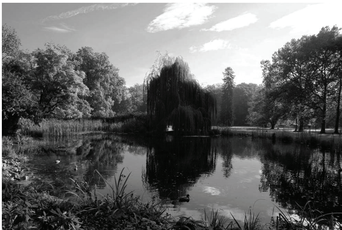
Vue de l'étang