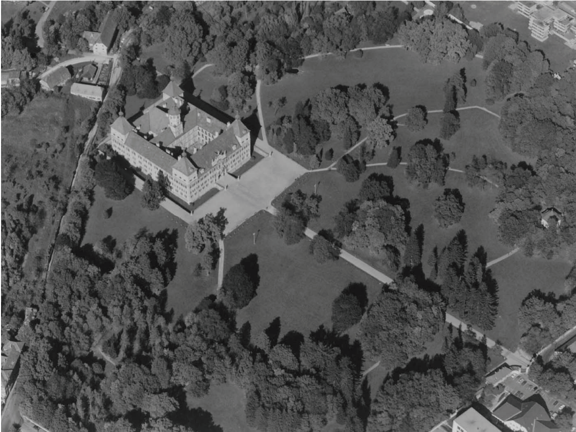
Vue aérienne du domaine d' Eggenberg