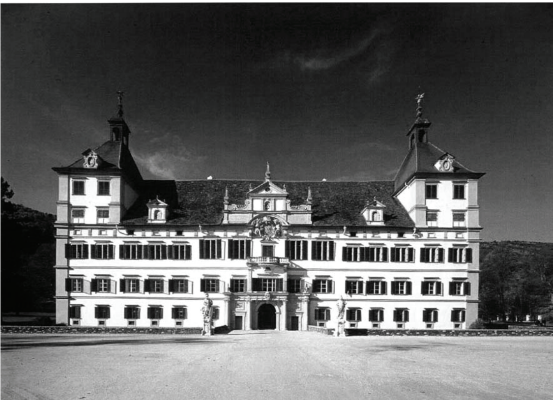
Château d' Eggenberg - façade principale