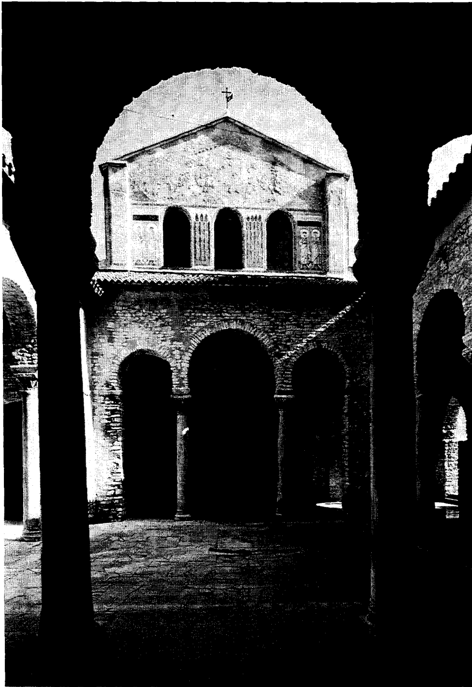
Porec : Porche de l'atrium et façade ouest de la basilique / The atrium porch and the west front of the Basilica