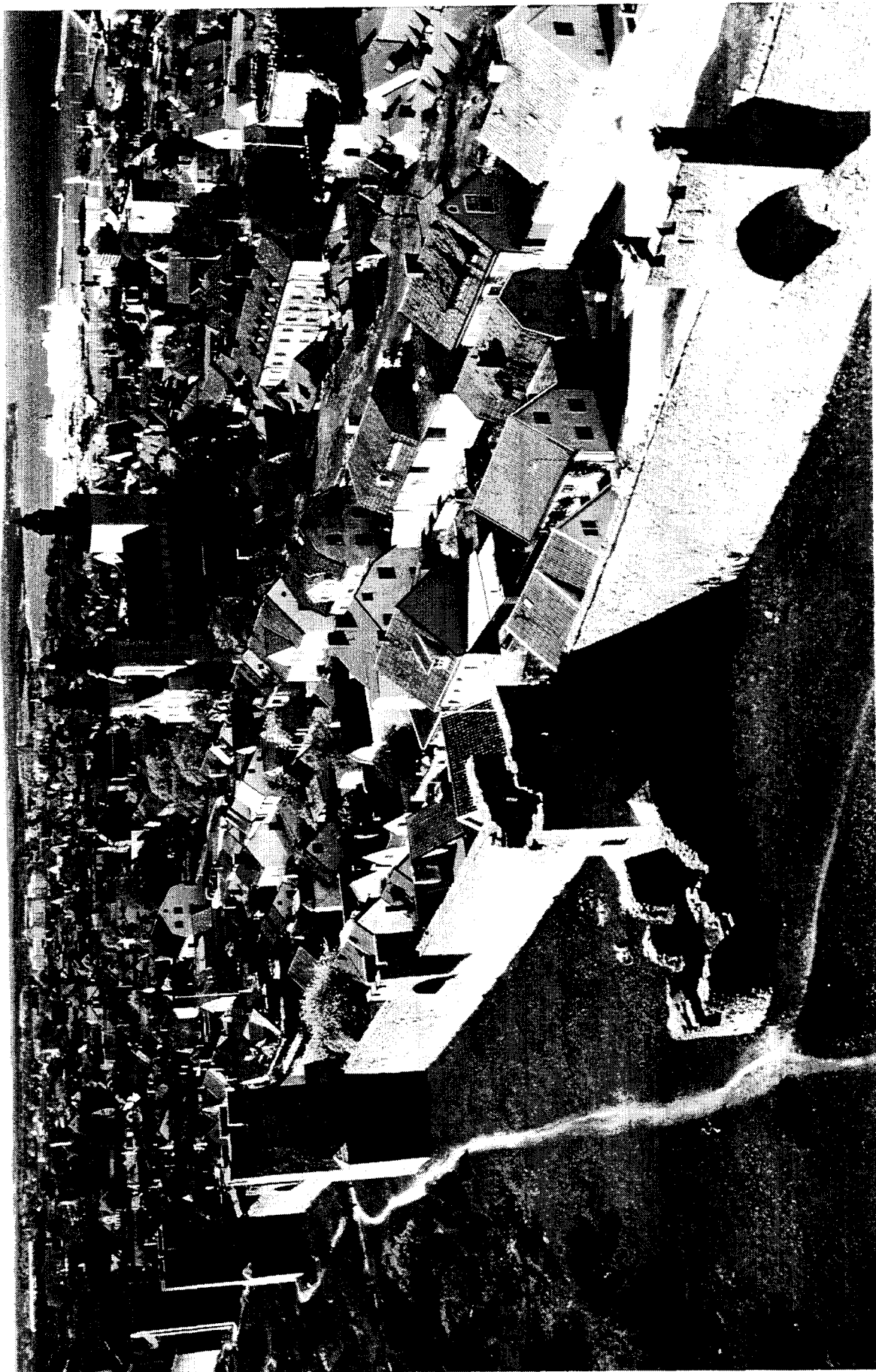
Visby : vue d'ensemble de la ville montrant les murs d'enceinte et la cathédrale /

General view of the town, showing the city walls and the cathedral