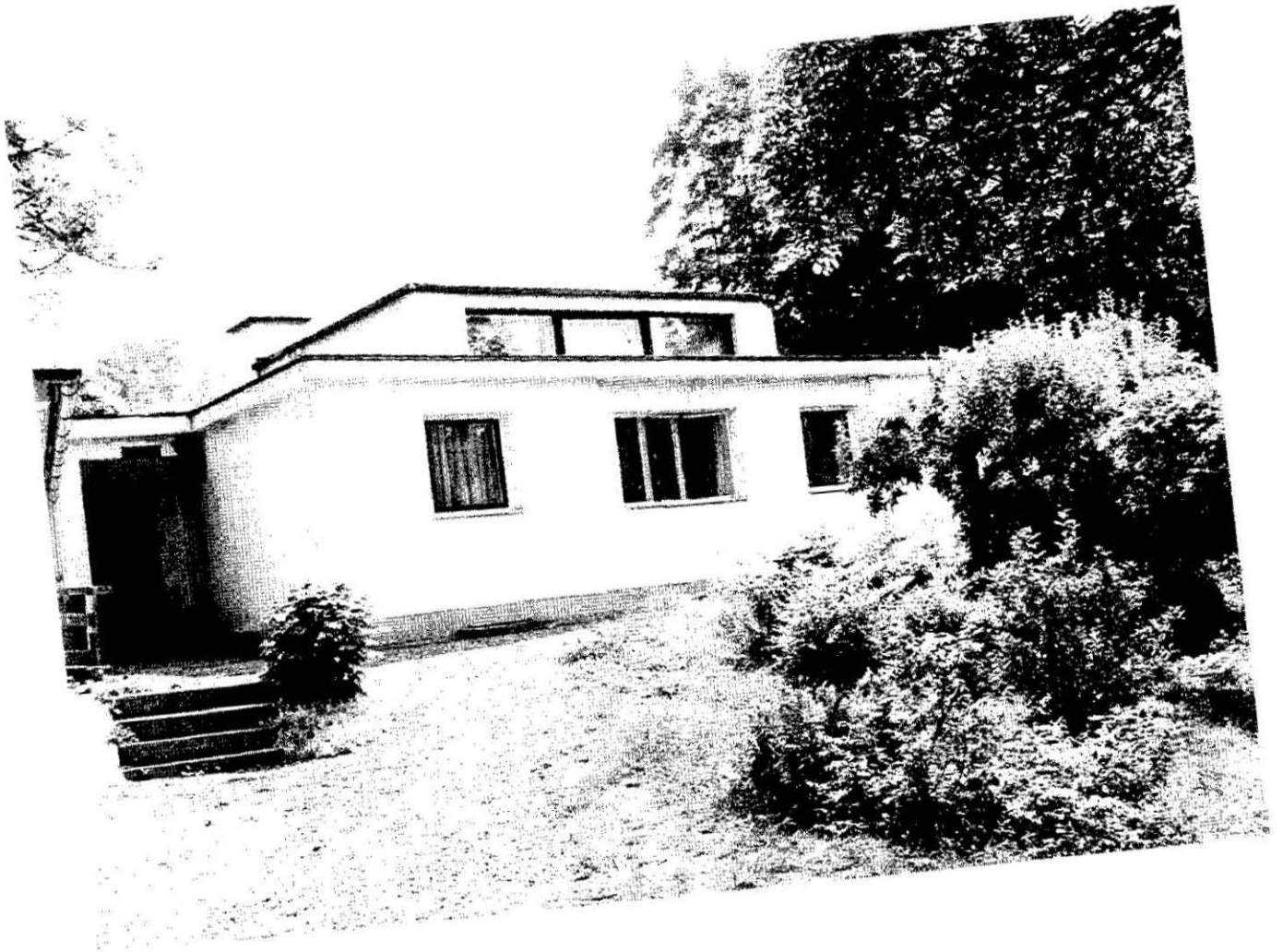
Weimar : Haus am Horn