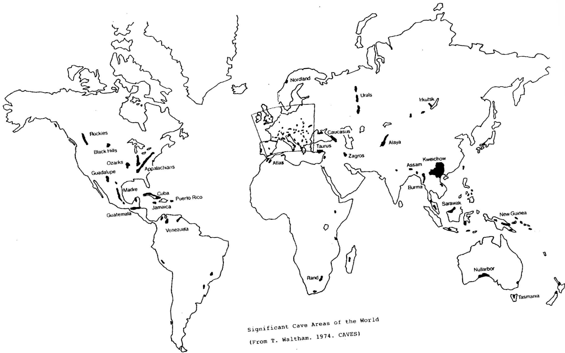
Significant Cave Areas of the World (From T. Waltham. 1974. CAVES)