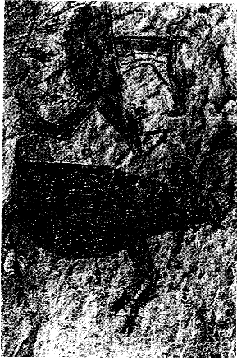
Réserve de El Vizcaino : Sierra de San Francisco, peinture préhispanique / The El Vizcaino Reserve : Sierra de San Francisco, pre-hispan. painting