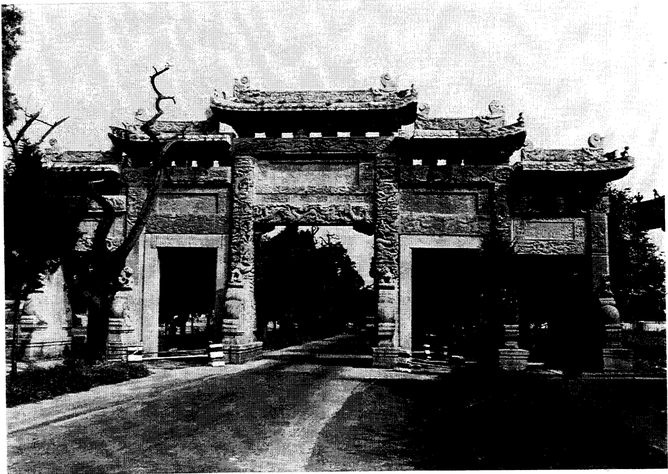
Cimetière de Confucius : arc Wan Gu Chang Chun / Cemetery of Confucius : arch Wan Gu Chang Chun