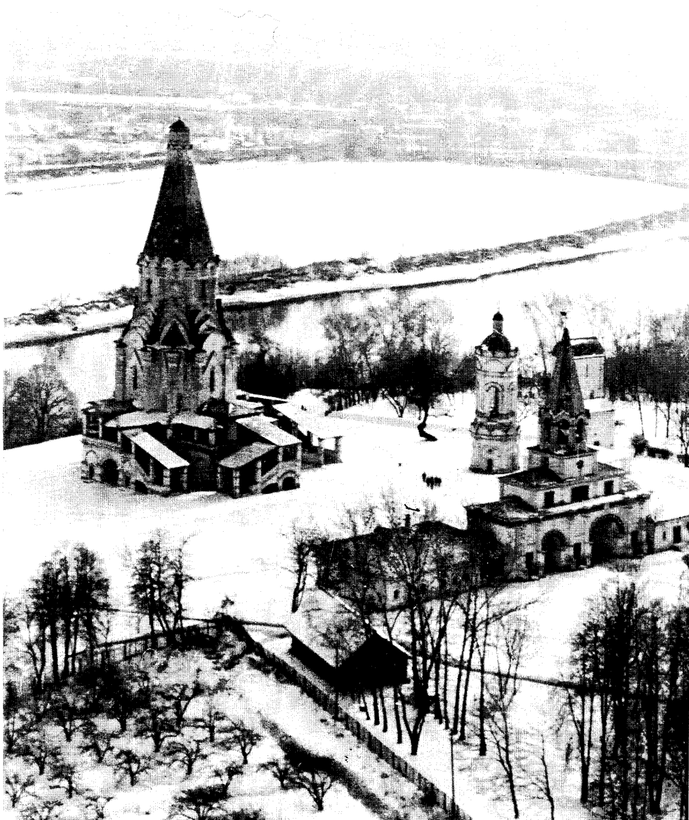
Kolomenskoïe : église de l'Ascension / Kolomenskoye : Church of the Ascension