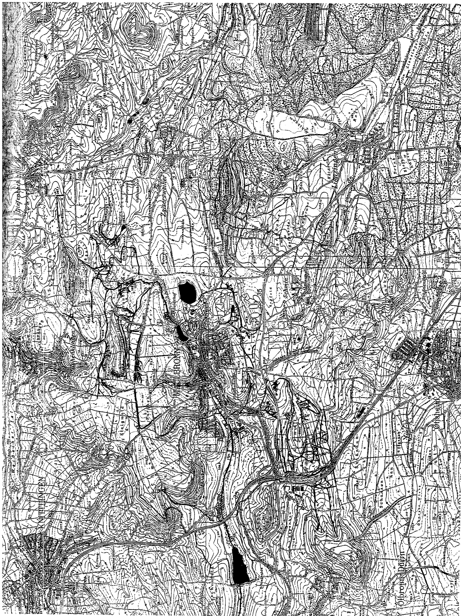
Maulbronn : proposition d'inscription incluant les aménagements hydrauliques / nomination including the hydraulic installations