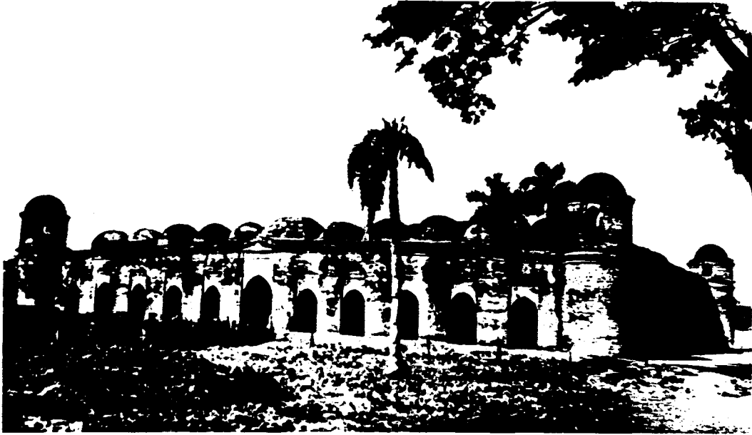
MOSQUEE DE SHAIT GUMBAD