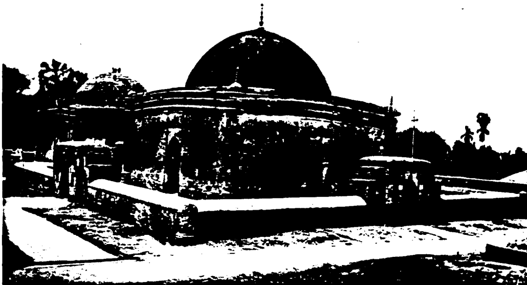
MAUSOLEE DE KHAN JAHAN