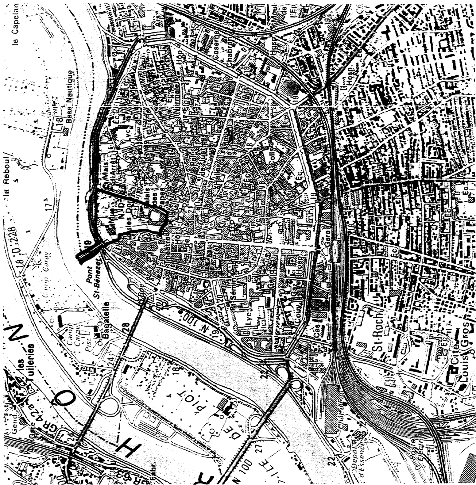
Avignon : carte indiquant la zone historique / Map showing the historic area