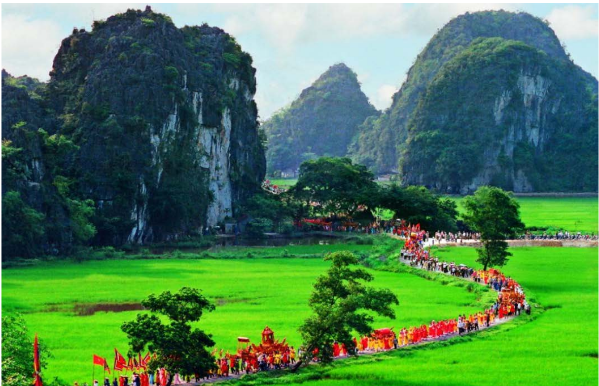
Festival Thai vi