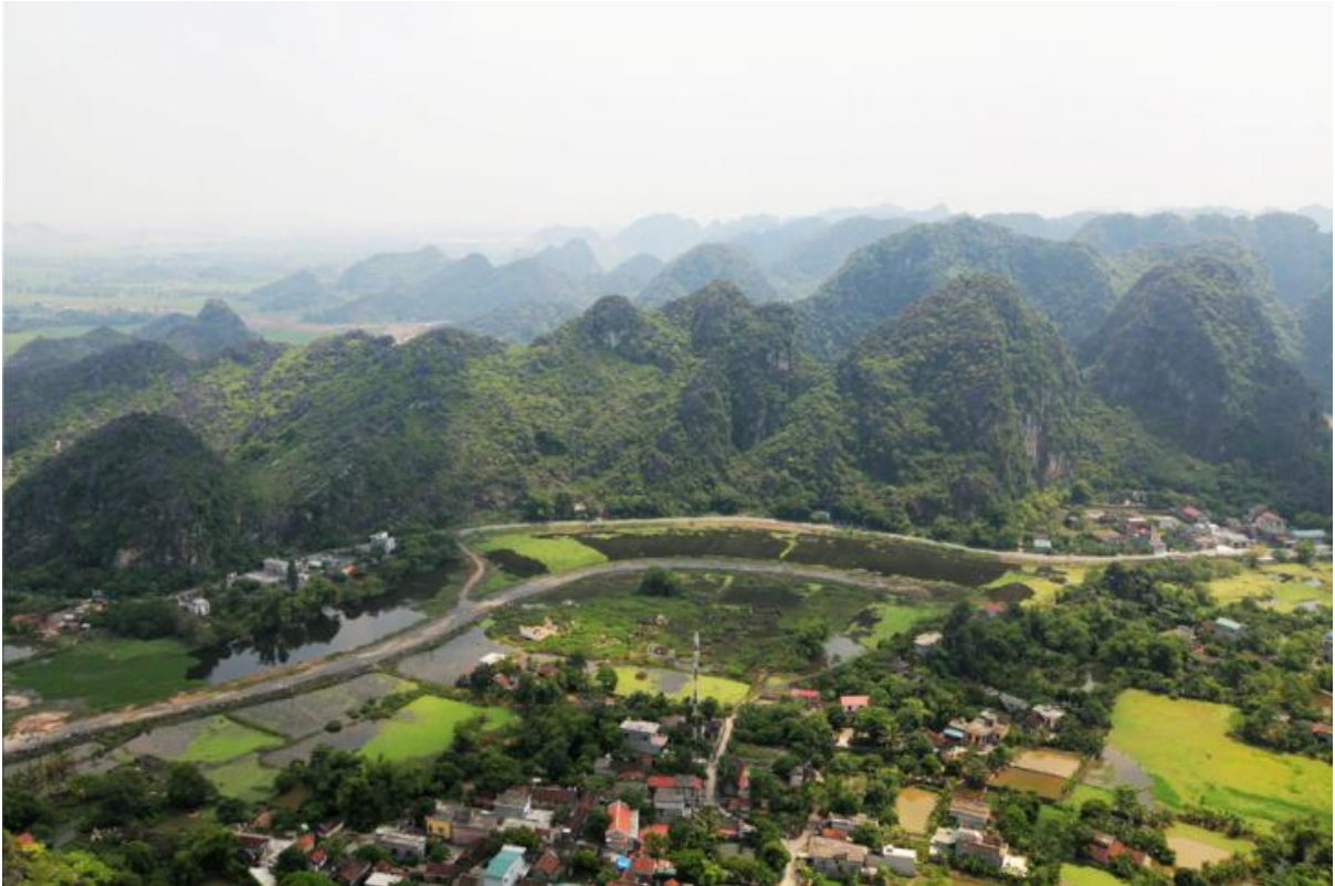
Vue du paysage