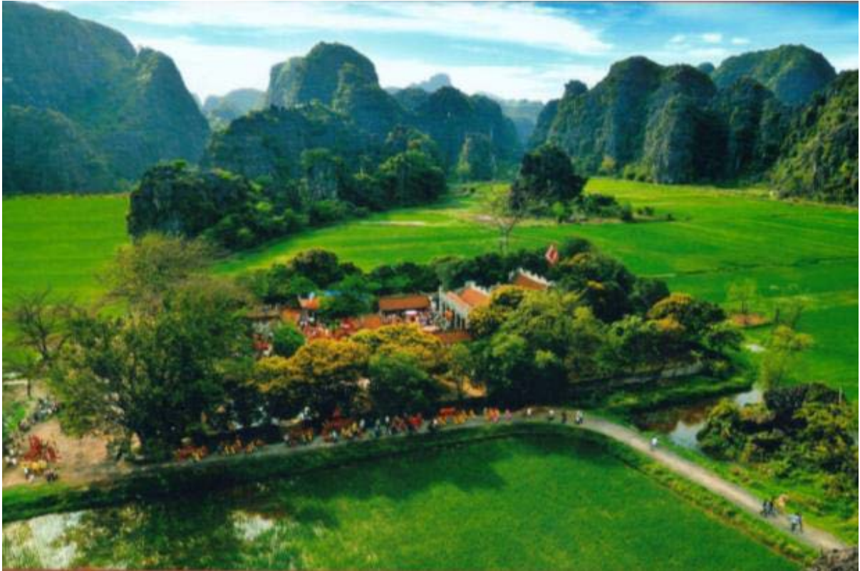
Vue générale du temple du roi Dinh