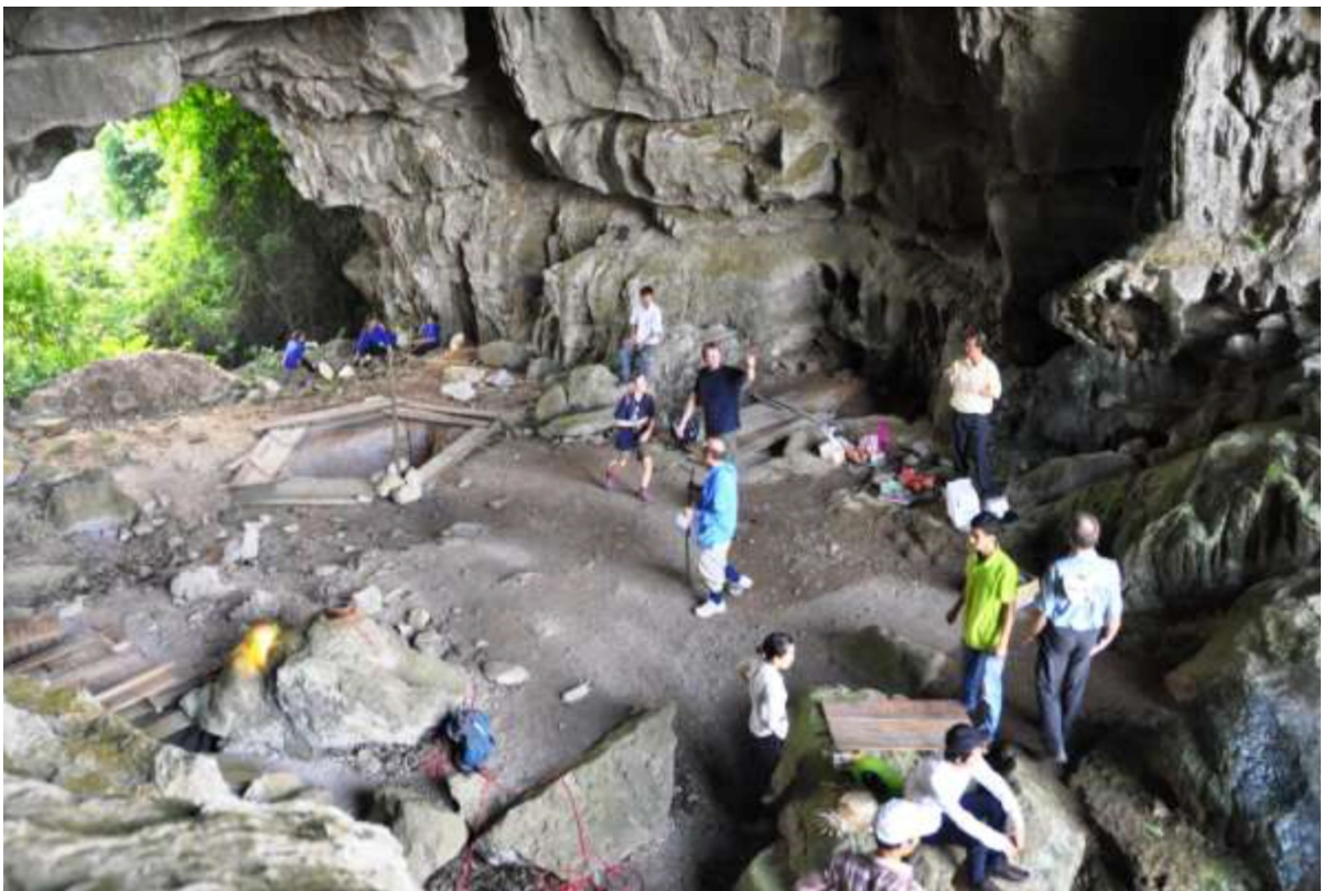
Abri sous roche