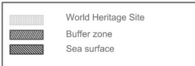
Table: Overview of surfaces