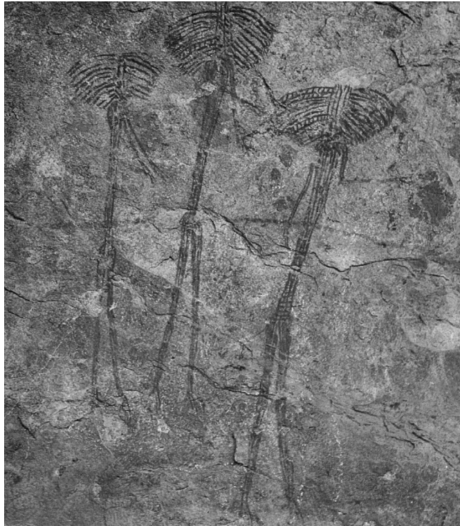
Peintures rouges anciennes de l'ensemble de Kolo