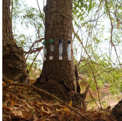
Tubes pollution monté sur arbre sur le site