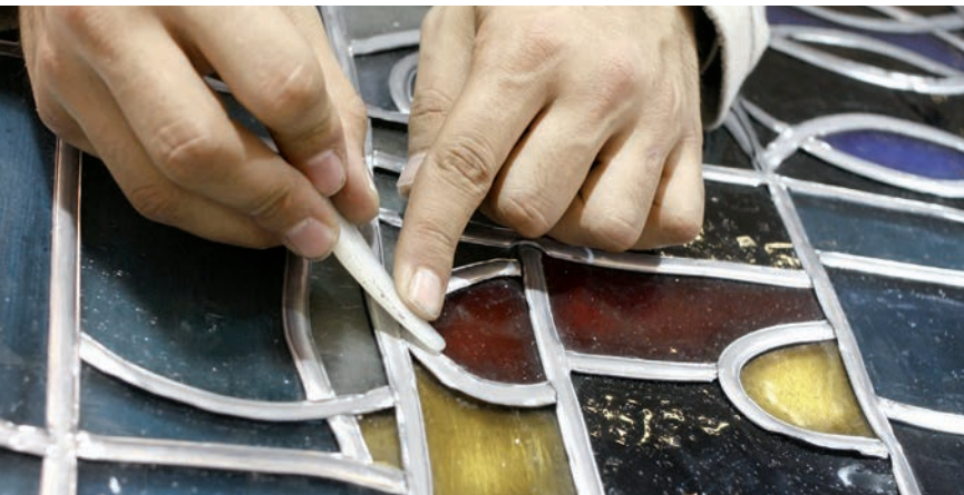
STÉPHANE PETIT - © PHOTOPIROUVENT

10H30 - 12H30 SALLE DE CONFÉRENCE DELORME 1