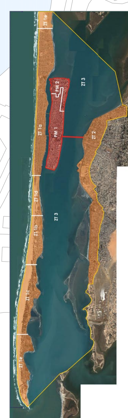
PM1, PM2 : périmètre du bien inscrit sur la liste du patrimoine mondial (carré rouge) ZT1, ZT2, ZT3 : Périmètre de la nouvelle zone tampon proposée (carré jaune)