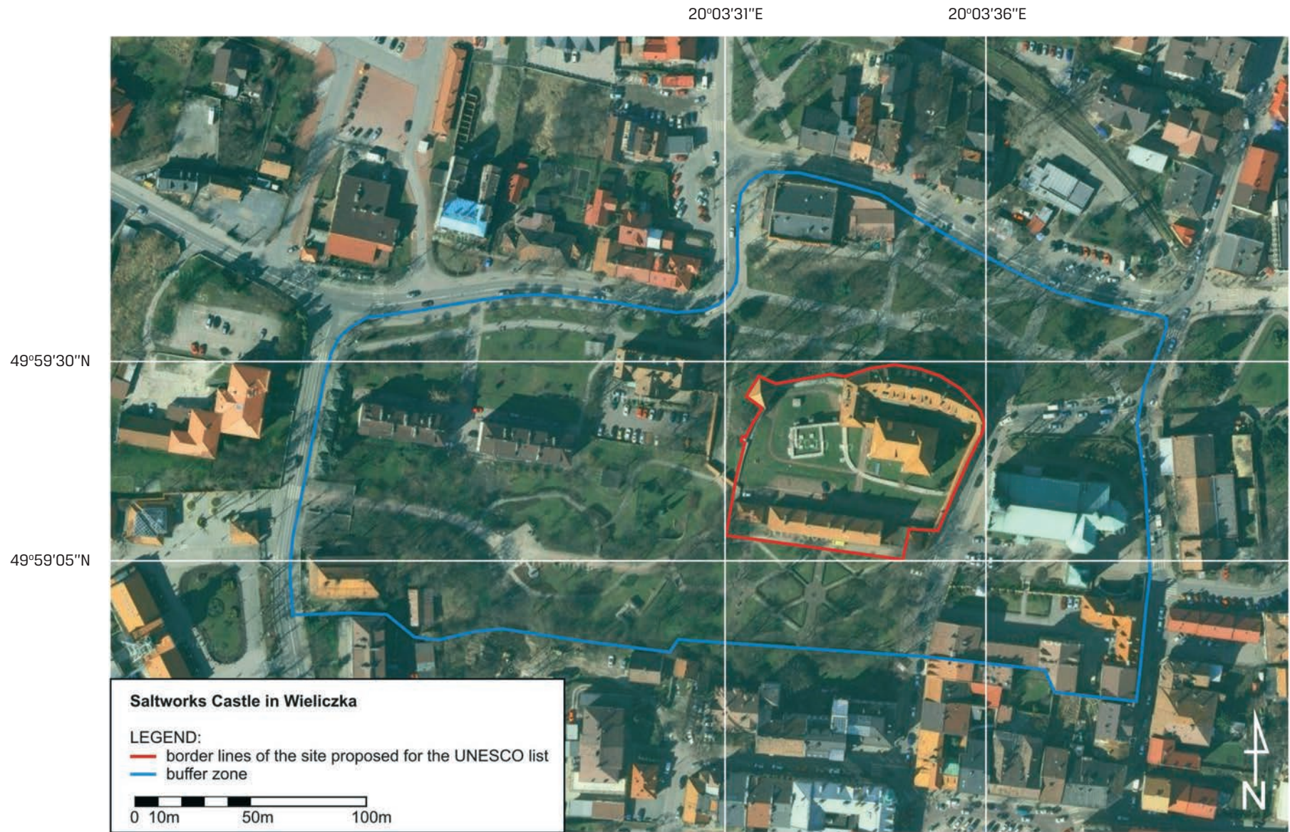
Saltworks Castle in Wieliczka, Boundaries of the proposed extension of the World Heritage property and buffer zone