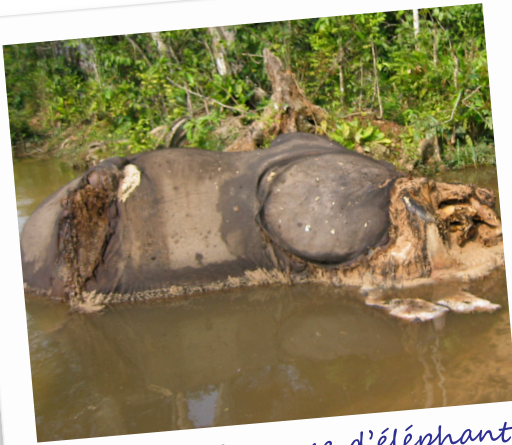
Carcasse d'éléphant