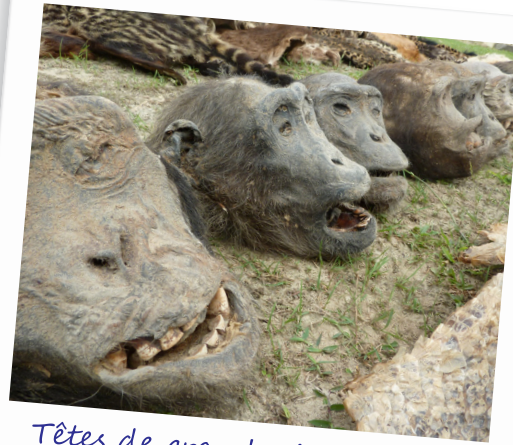
Têtes de grands singes saisies

Le paysage Tri-national Dja-Odzala-Minkébé (TRIDOM) s'étend sur près de 187 000 km 2 sur les territoires des Républiques du Cameroun, du Congo et du Gabon. Il comprend au total neuf aires protégées, dont la Réserve de faune du Dja (République du Cameroun), inscrite comme Site du patrimoine mondial.