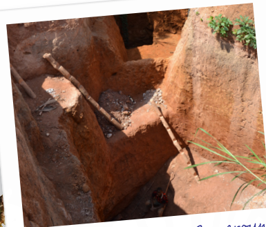
Mine artisanale au Cameroun