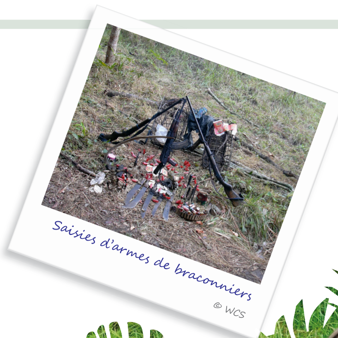
Saisies d'armes de braconniers