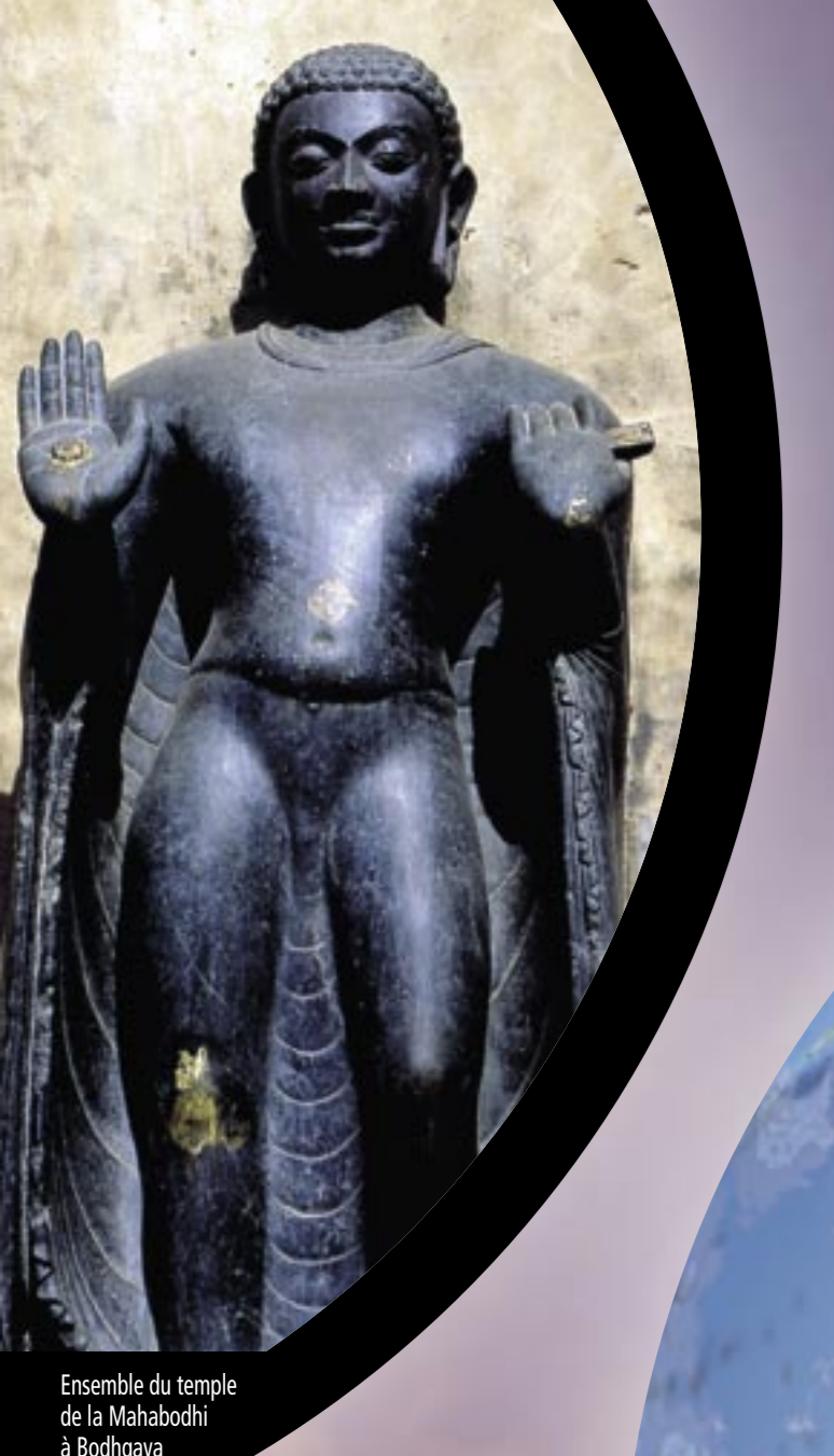
Inventaire du temple de Bahaygu (Inde)