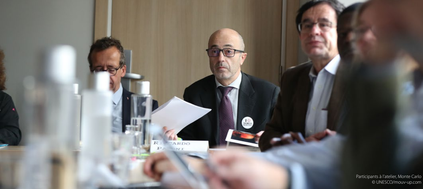
Participants à l'atelier, Monte Carlo

danger critique d'extinction 20 . Le Dôme est exposé aux menaces potentielles du trafic maritime, de la pêche, de la pollution d'origine marine et terrestre et du changement climatique.