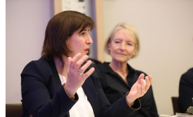
Participants à l'atelier, Monte Carlo