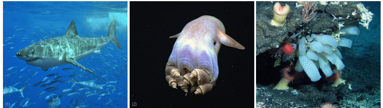
1/ Grand requin blanc au large de l'île de Guadalupe, au Mexique, août 2006. Animal d'une taille estimée comprise entre 3,30 et 3,60 m, âge inconnu. 2/ Un Grimpoteuthis (« Dumbo octopus ») affiche une posture corporelle jamais observée auparavant chez les octopodes cirrates. 3/ Jardins de coraux diversifiés et communautés complexes de falaise maritime d'eau profonde, caractérisées par de grandes anémones, d'énormes éponges et des octocoralliaires sur l'Atlantis Bank, dans le sud-ouest de l'océan Indien.