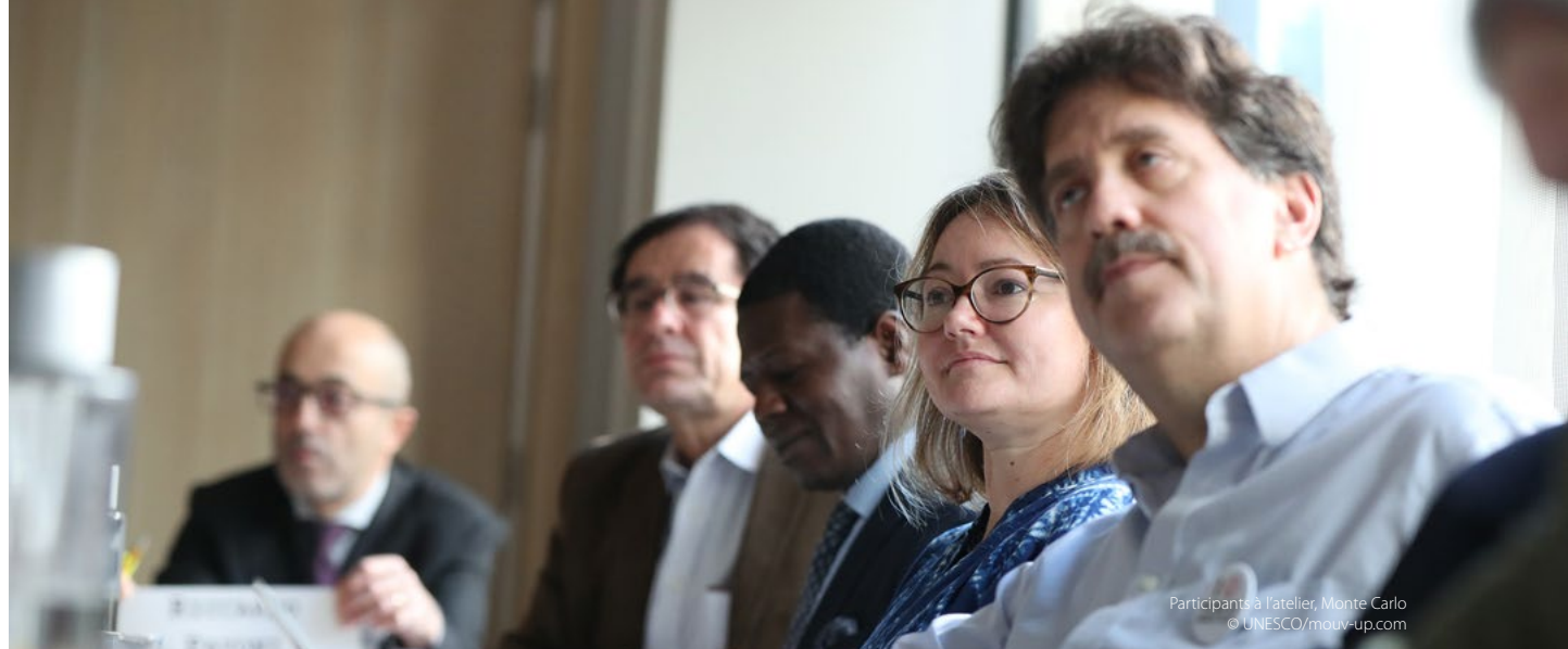
Participants à l'atelier, Monte Carlo

l'histoire de la Terre ou des points chauds de biodiversité à caractère exceptionnel. Depuis l'inscription de La Grande Barrière australienne en 1981, le patrimoine mondial marin s'est enrichi pour devenir une collection mondiale de lieux océaniques sans équivalent qui s'étend des tropiques aux pôles (voir la figure 1).