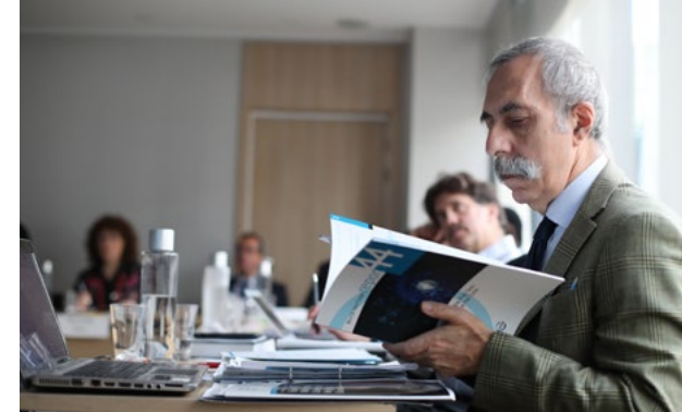
Participants à l'atelier, Monte Carlo

La publication d'une Liste indicative n'implique l'expression d'aucune opinion de la part du Comité du patrimoine mondial, du Centre du patrimoine mondial ou de l'UNESCO concernant le statut juridique d'une zone qui y est inscrite, et donc, d'après les experts, rien n'empêche un État partie d'inclure des sites localisés au-delà des limites de son territoire ou de sa juridiction. Toutefois, comme les Orientations prévoient que les biens soient situés sur le territoire des États parties, des orientations supplémentaires apporteront des éclaircissements et constitueraient une aide