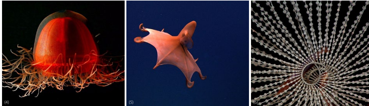
4/ Crossota sp., une méduse rouge trouvée peu avant le fond des eaux profondes, Alaska, mer de Beaufort, au nord de Point Barrow. 5/ Un Grimpoteuthis (« Dumbo octopus ») vu lors de l'exploration du mur ouest de Mona Canyon. 6/ Vue sur l'axe d'un corail Iridogorgia . Remarquez les grosses crevettes à gauche et une étoile cassante à droite.