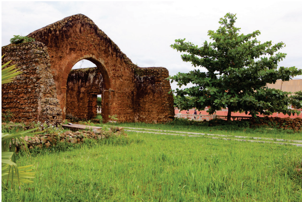
Kulumbimbi - Ancienne cathédrale