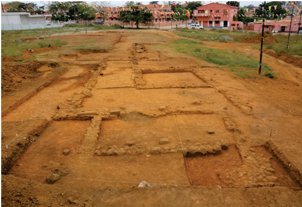
Vue générale du site Tadi dya Bukikwa