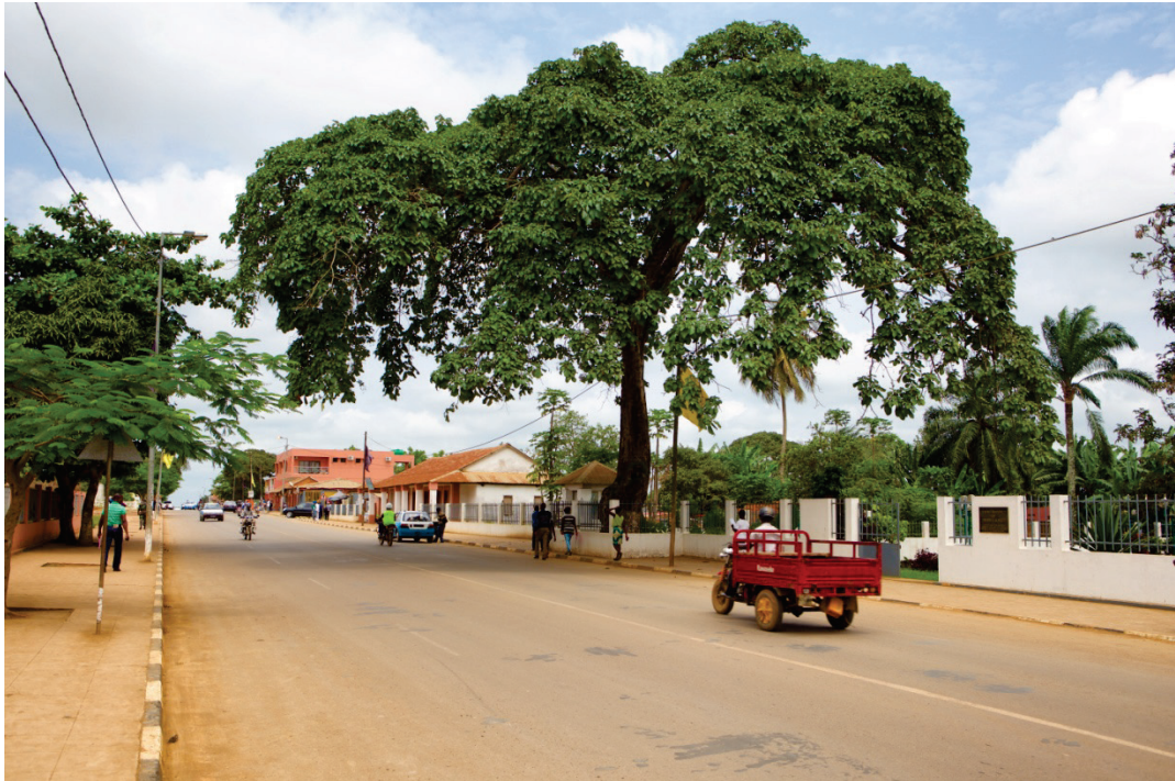
L'arbre sacré Yala Nkuwu