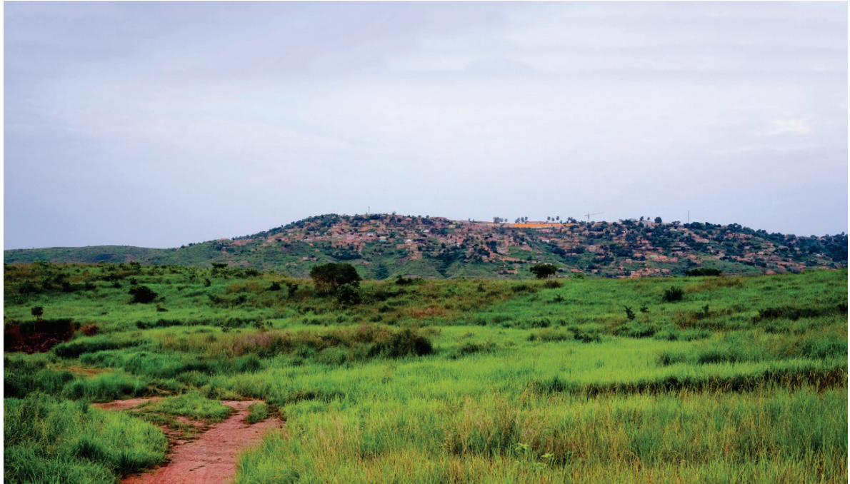
Vue du plateau de Mbanza Kongo