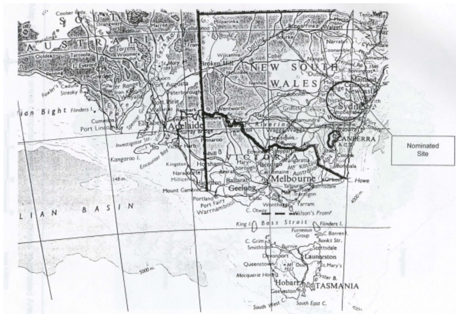
Carte 1: Localisation – La région des Montagnes Bleues