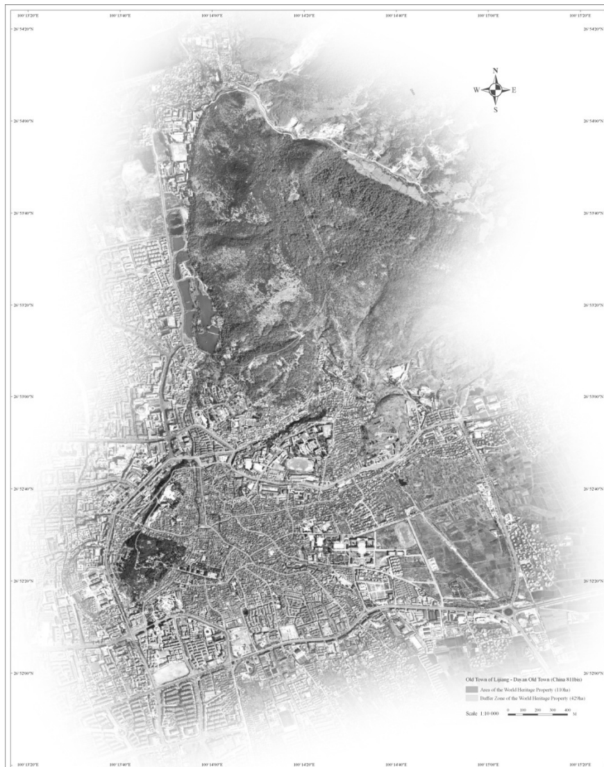
Vieille ville de Dayan – plan indiquant les délimitations révisées du bien