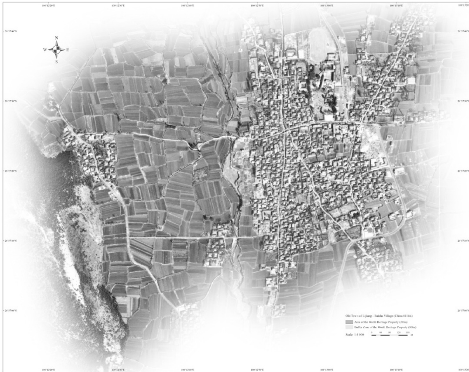
Village de Basha - plan indiquant les délimitations révisées du bien