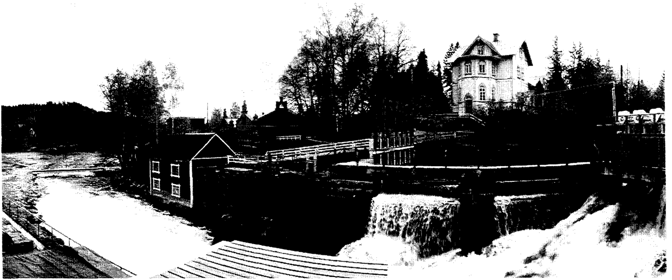
Verla : l'usine et ses environs (1995)