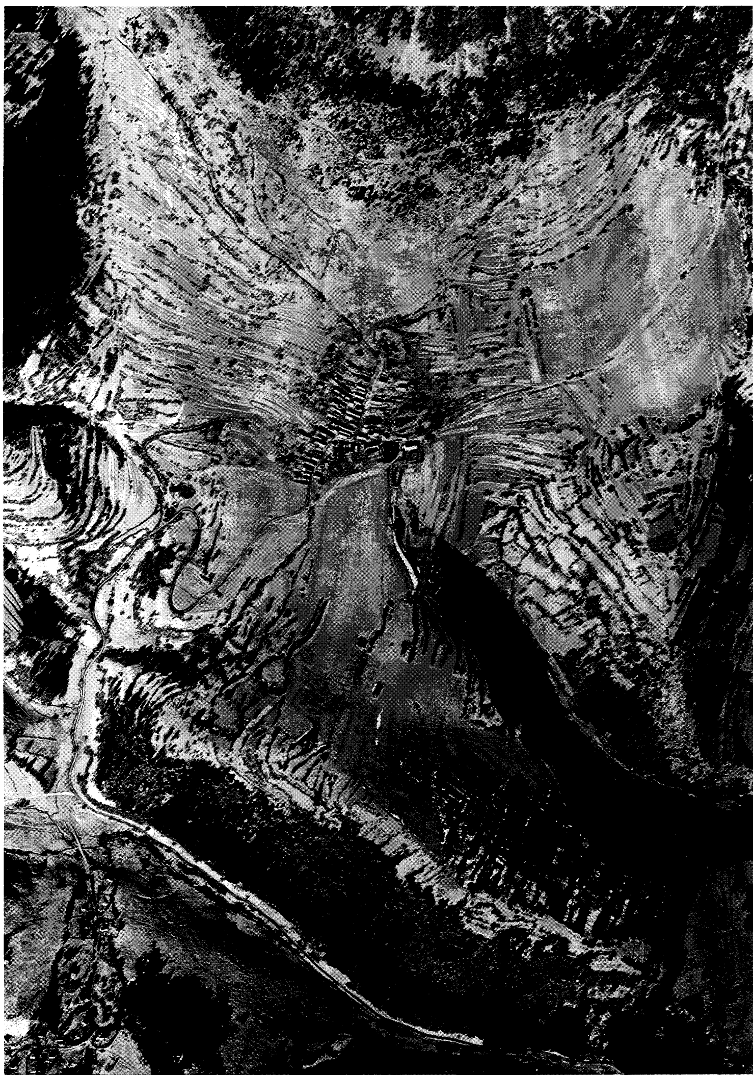
Vlkolinec : vue aérienne / aerial view