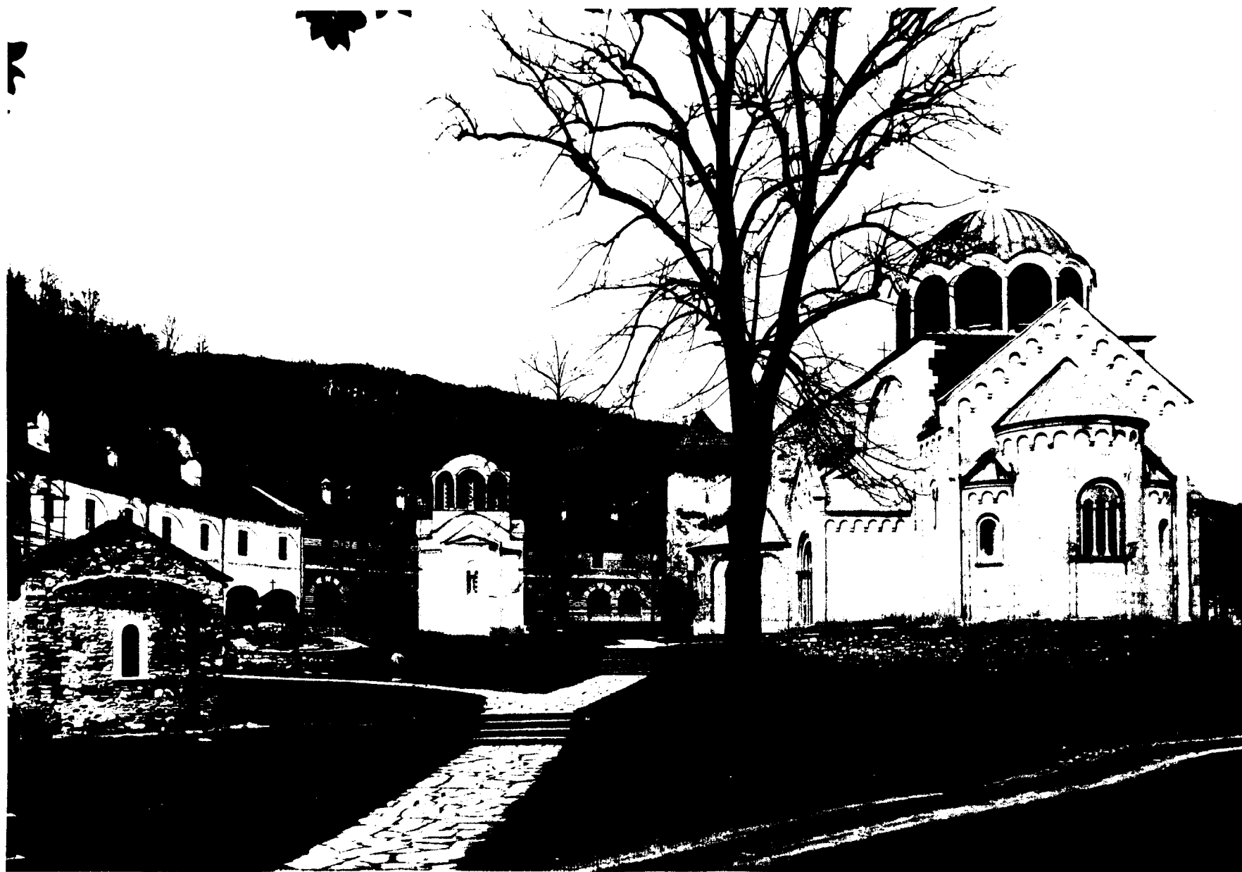
STUDENICA : St. Nicolas, Eglise du Roi et Eglise de la Vierge, vue du côté est (1983).