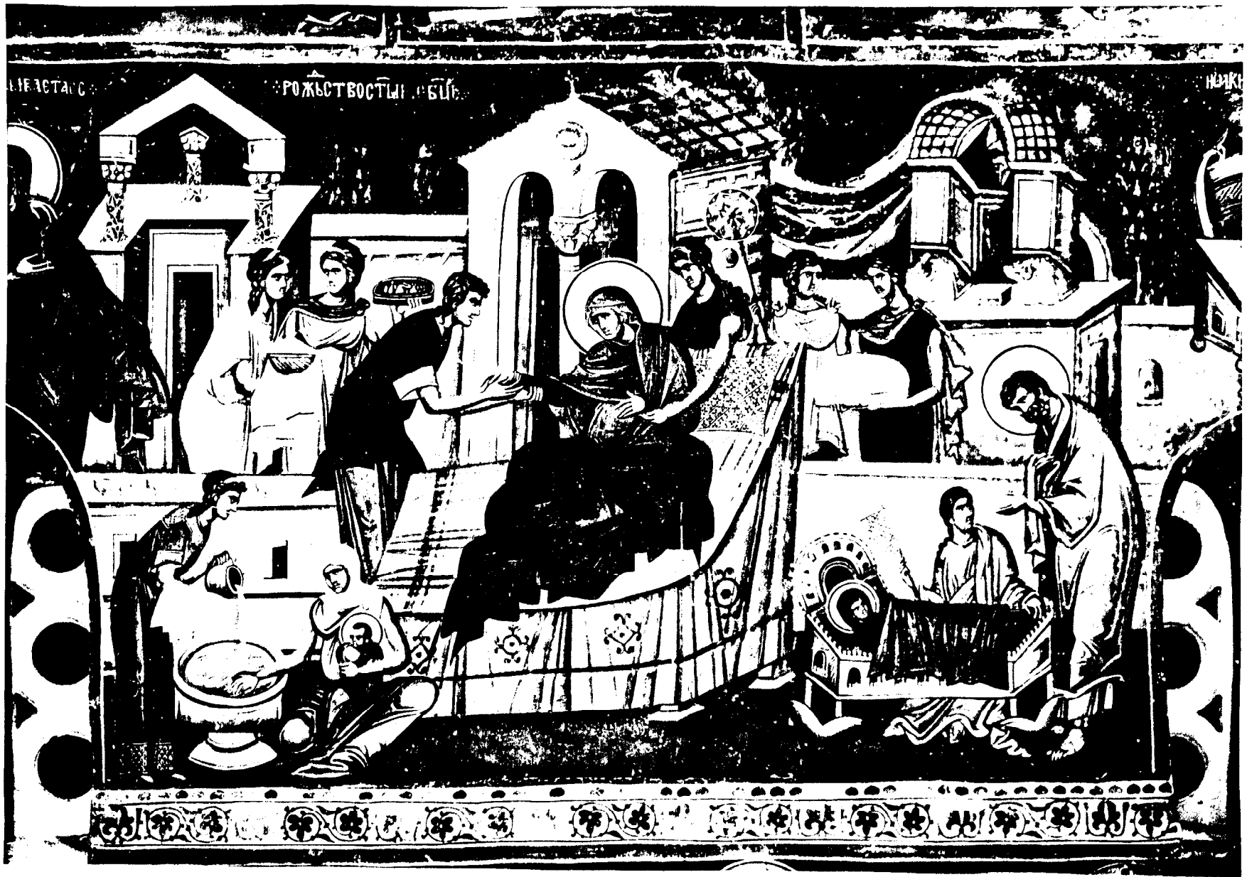
Eglise du Roi, Nativité de la Vierge (1985).