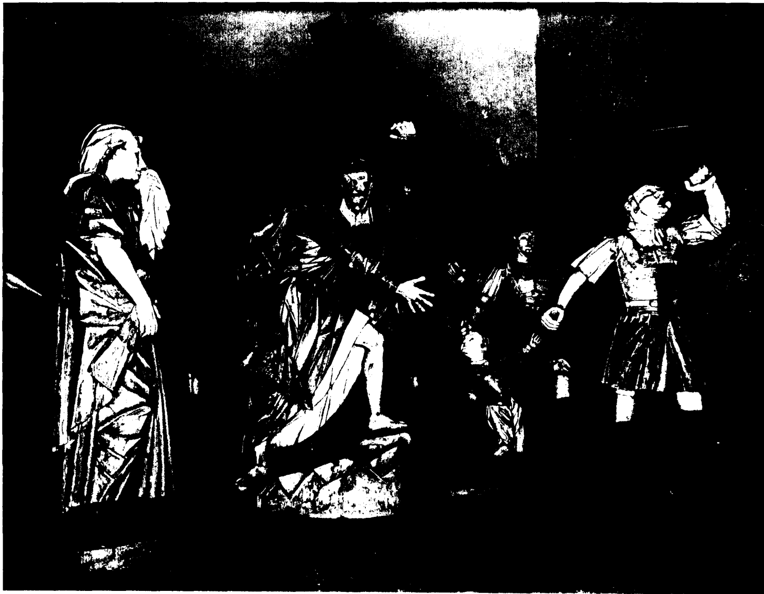
Bom Jesus do Matozinhos : ensemble du Portement de Croix.