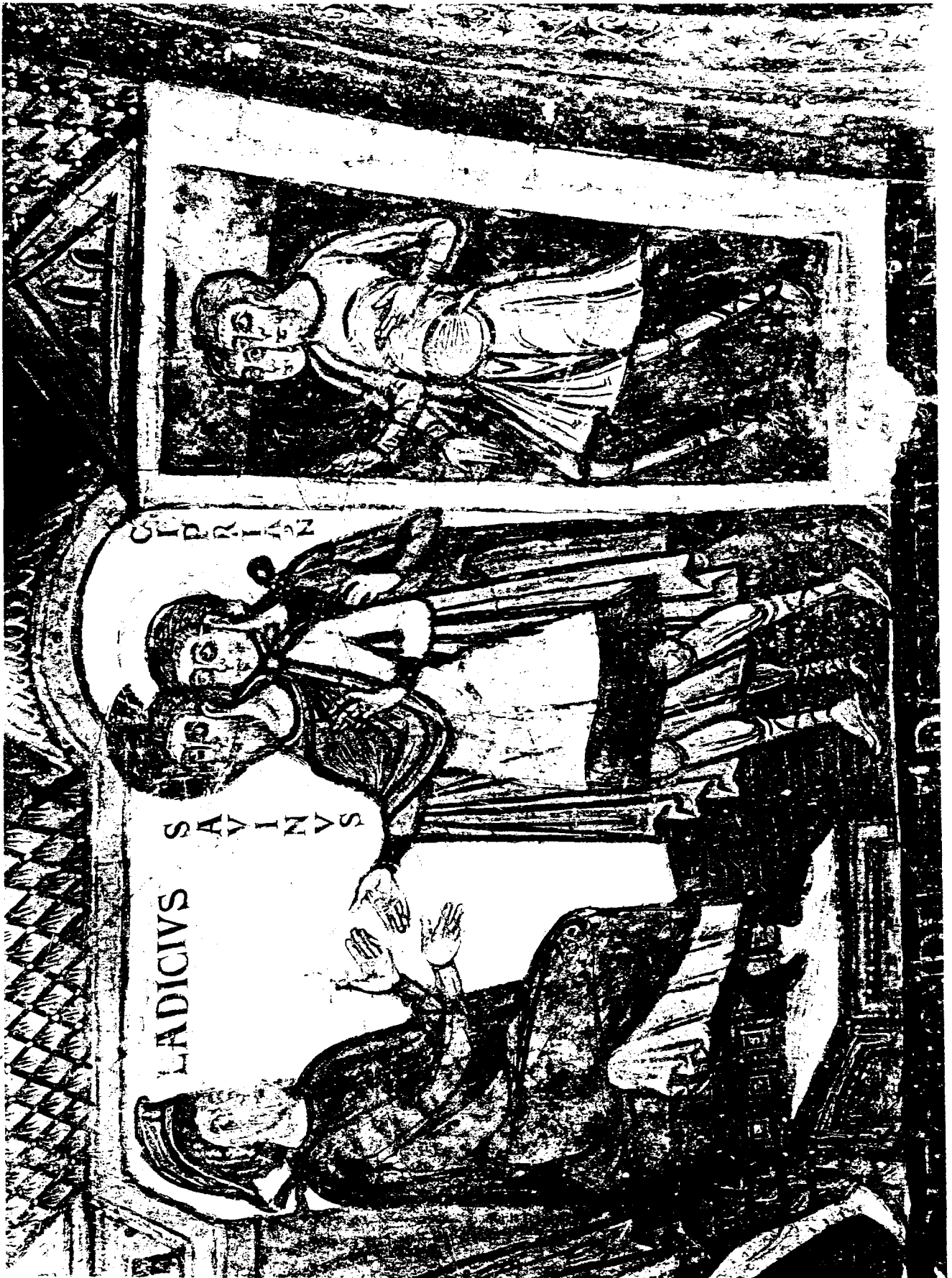
SAINT-SAVIN-sur-GARTEMPE (Vienne) Eglise Crypte Saint-Savin & Saint-Cyprien - peintures murales - Scènes de la vie de Saint-Savin et de Saint-Cyprien