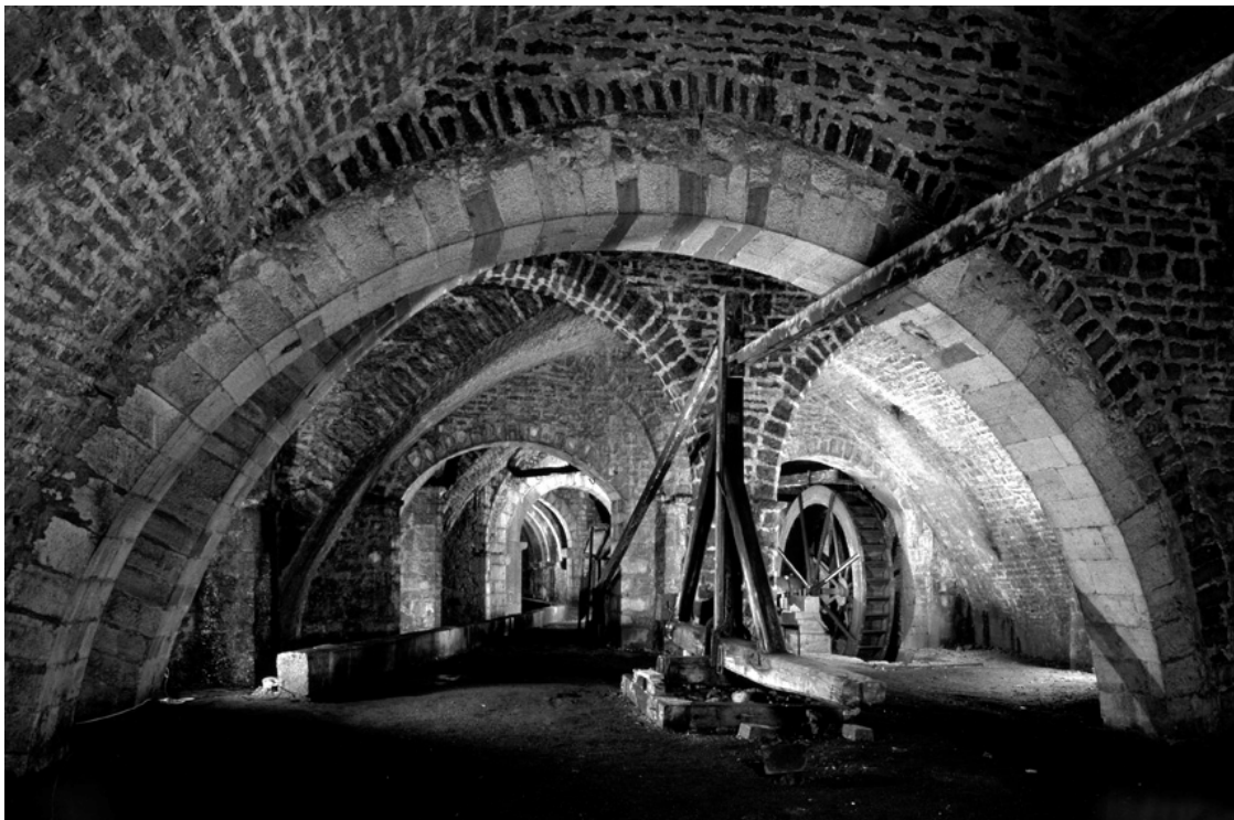
Puits d'Amont - puits d'extraction de la saumure