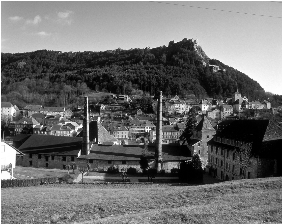
Vue générale de la grande saline de Salins-les-Bains