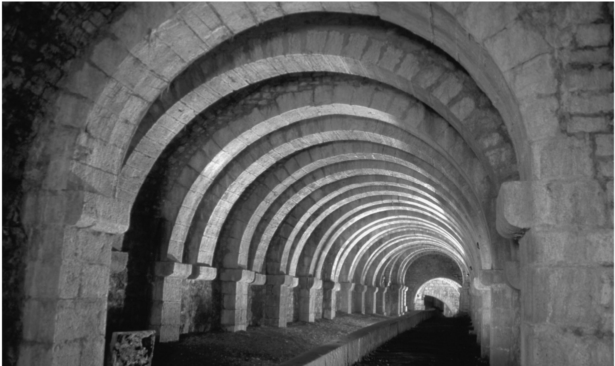
Galerie souterraine monumentale