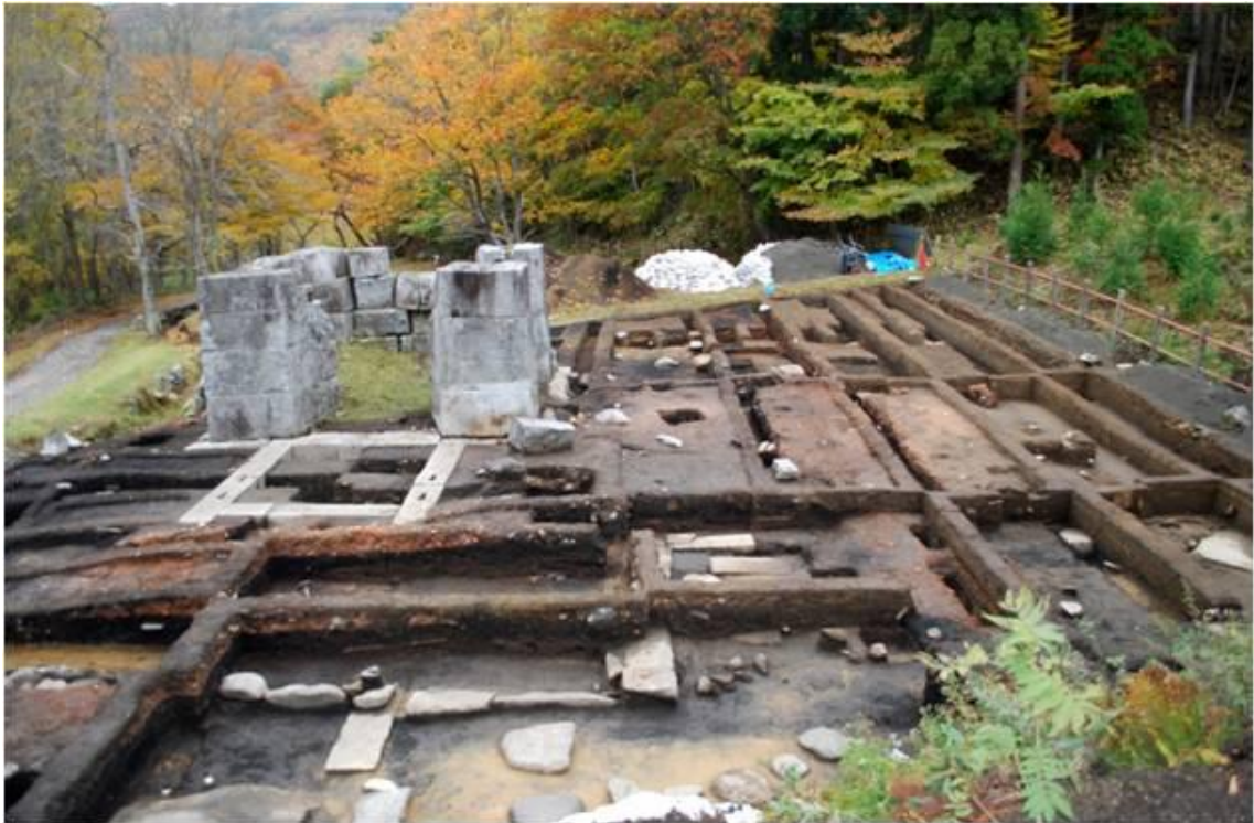
Fouilles archéologiques du haut fourneau de Hashino