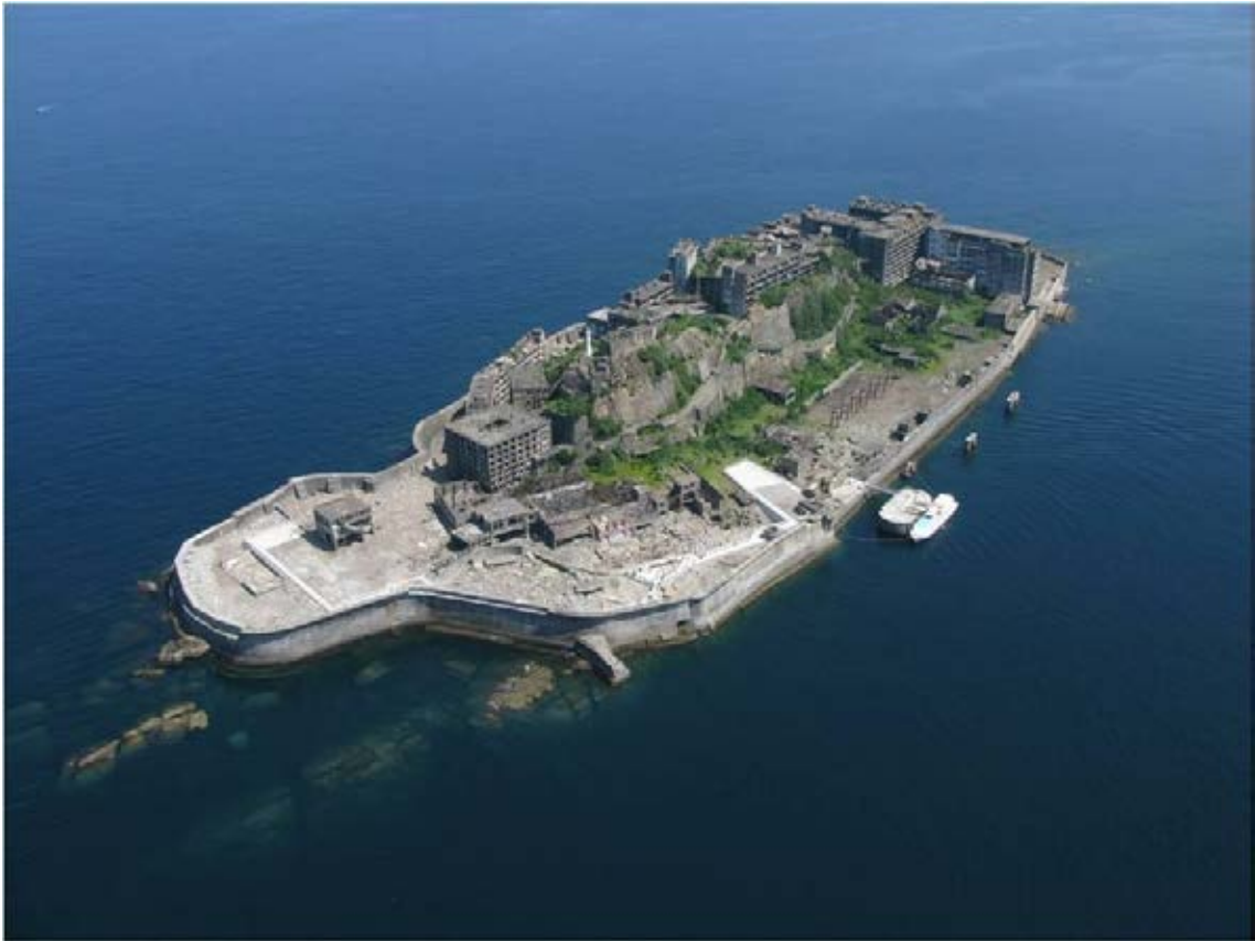
Mine de charbon de Hashima (Gunkanjima)