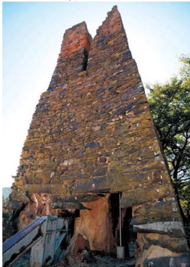
Four à réverbère de Hagi