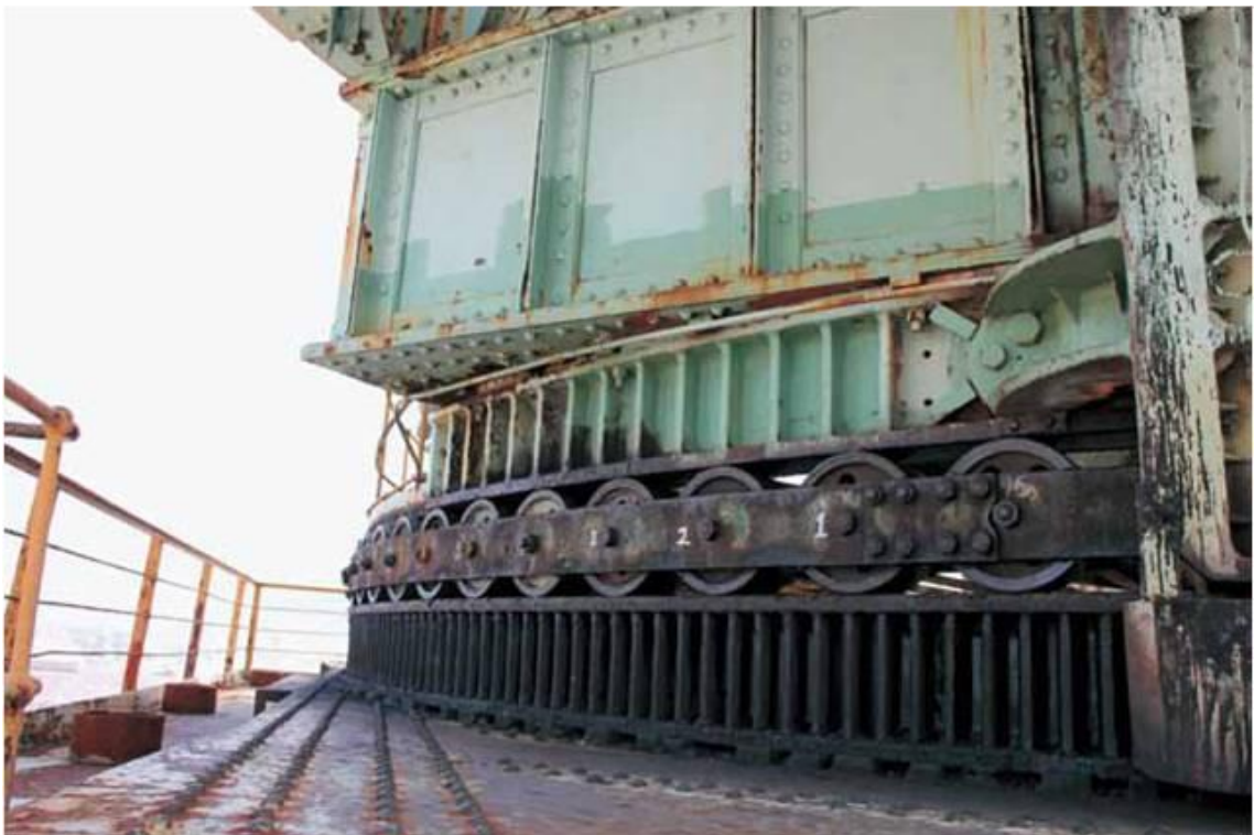
Grue cantilever géante de Mitsubishi