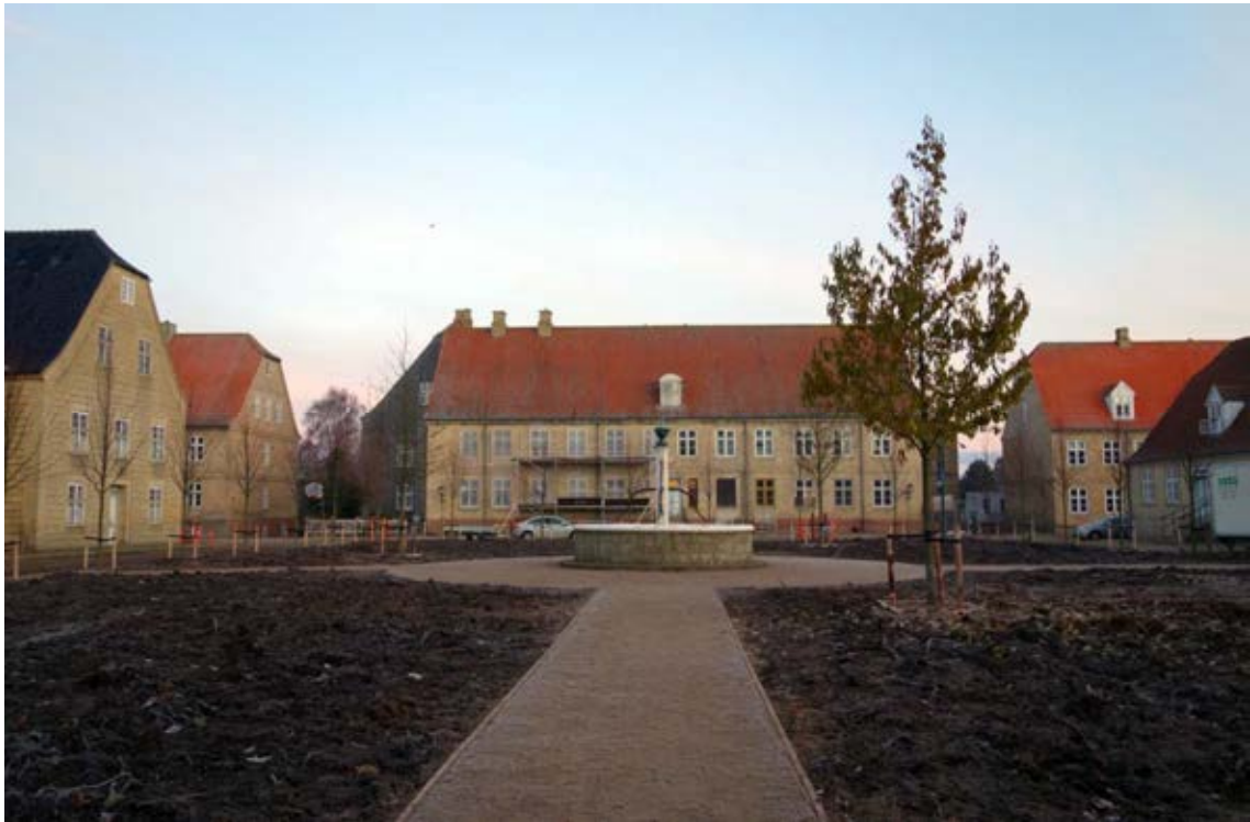
Place de l'église