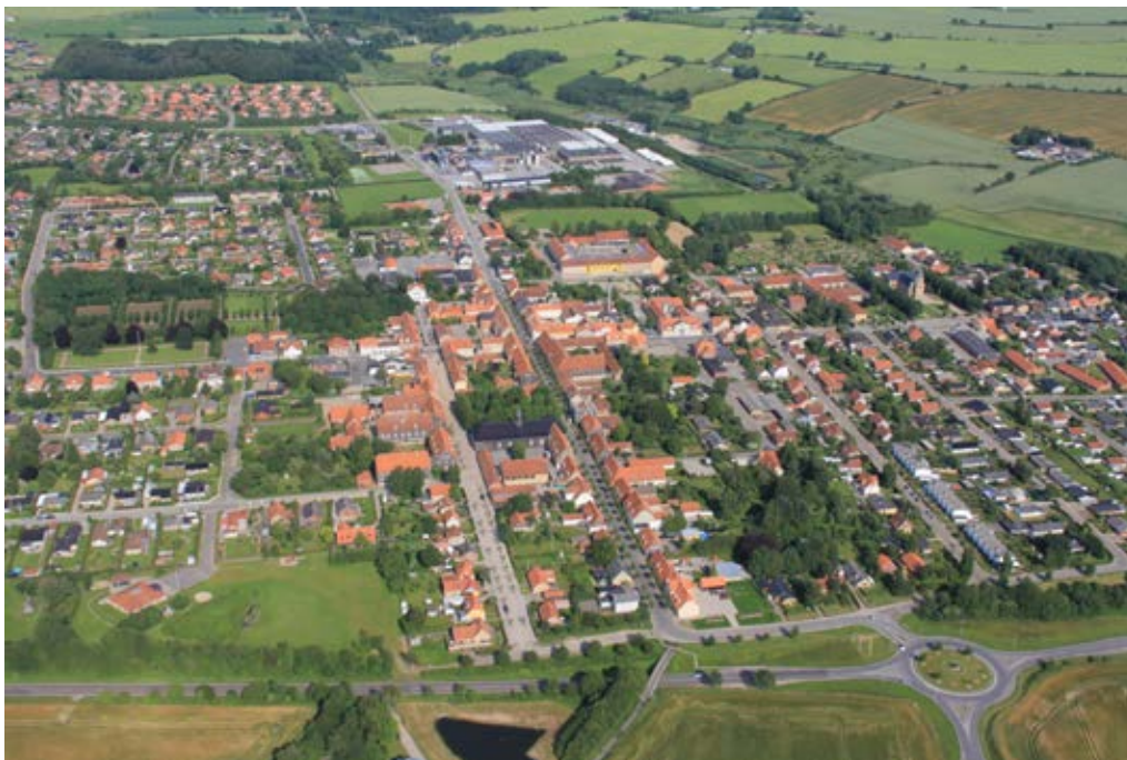
Vue aérienne de Christiansfeld