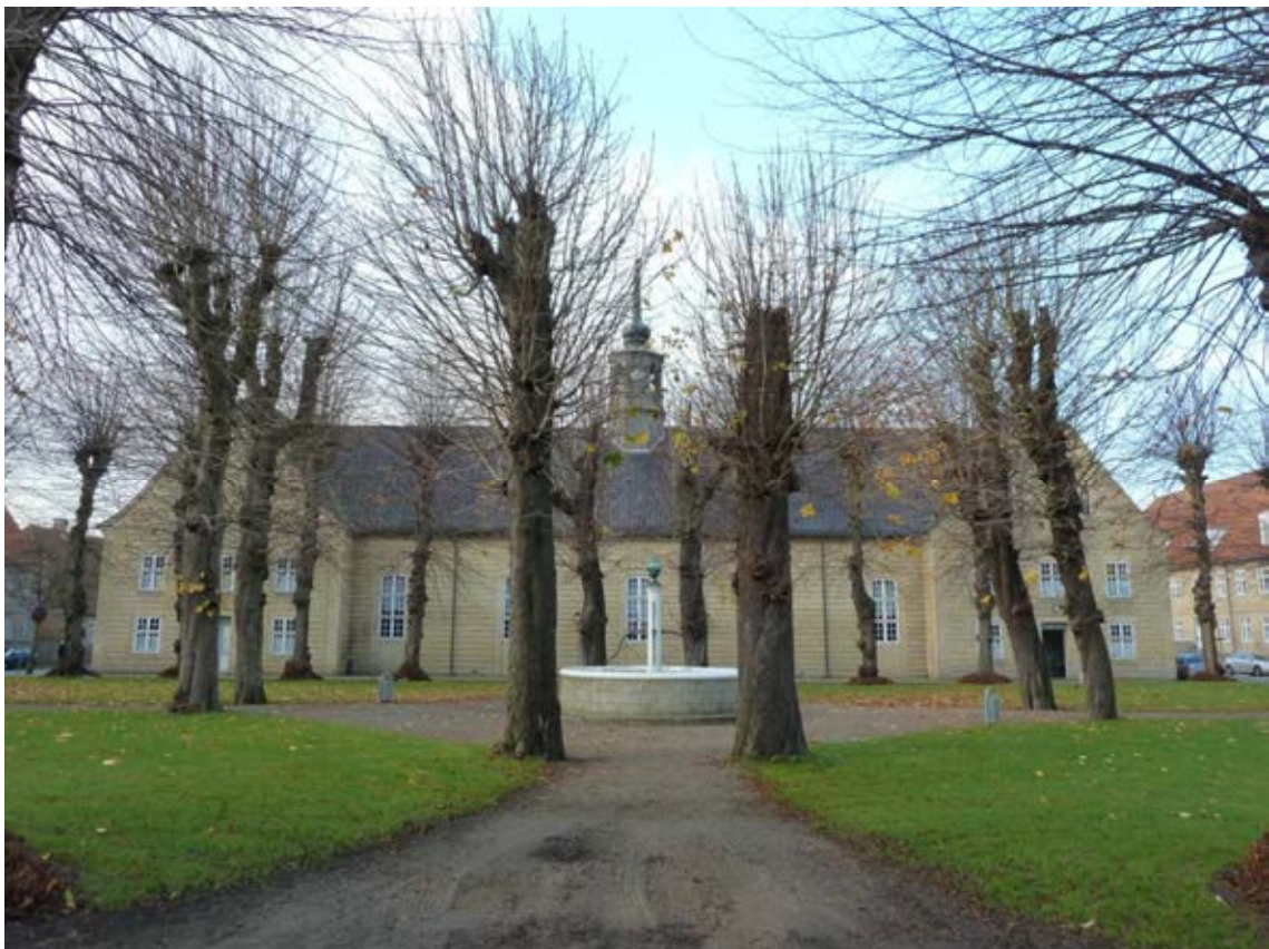
Façade de l'église