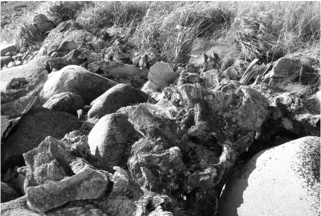
Ossuaire de baleines