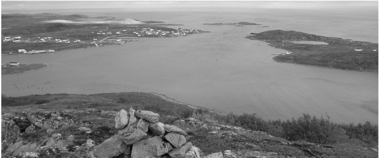
Vue du port de Red Bay