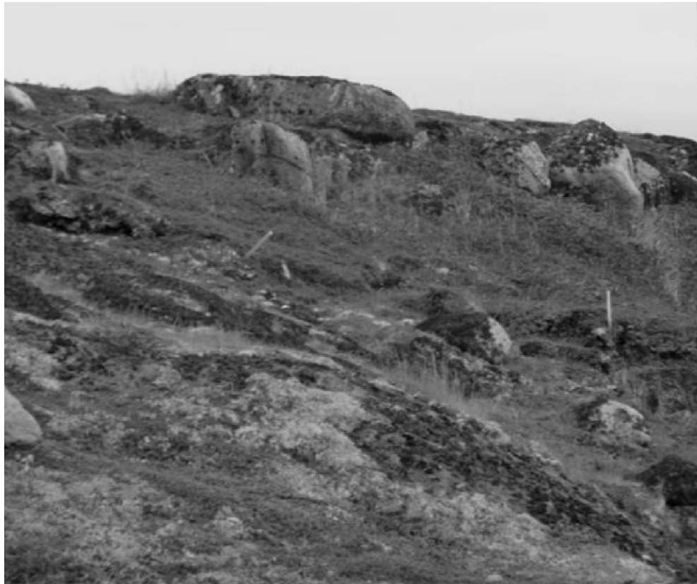
Vestiges des ateliers d'assemblage de tonneaux