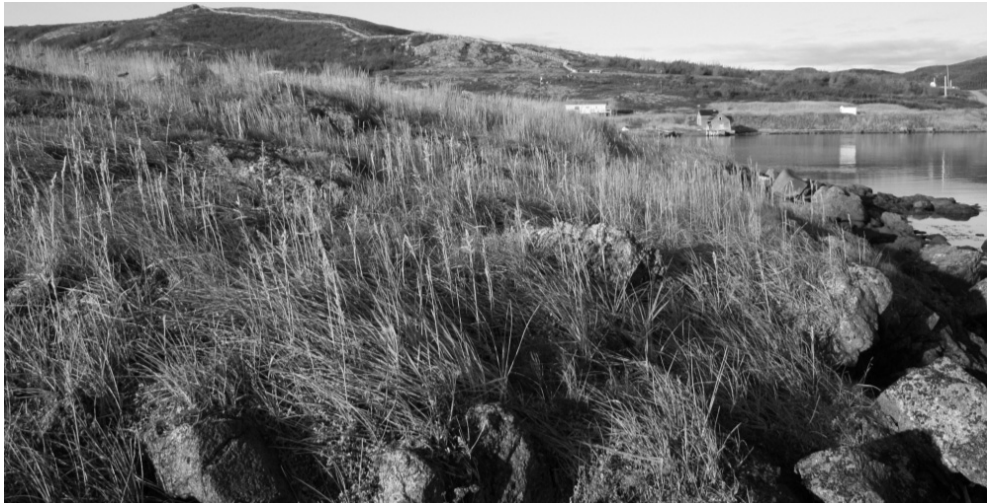
Site de fourneaux sur l'île Penney