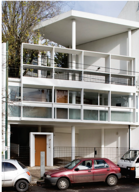
Élément 11 : Maison du Docteur Curutchet – La Plata, Argentine