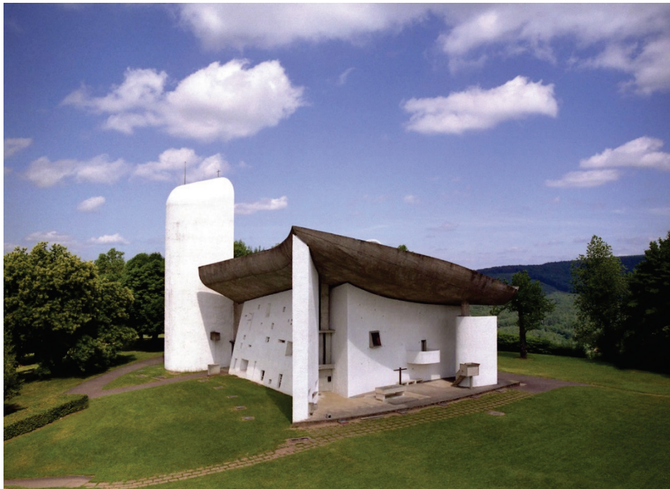
Élément 12 : Chapelle Notre-Dame-du-Haut – Ronchamp, France