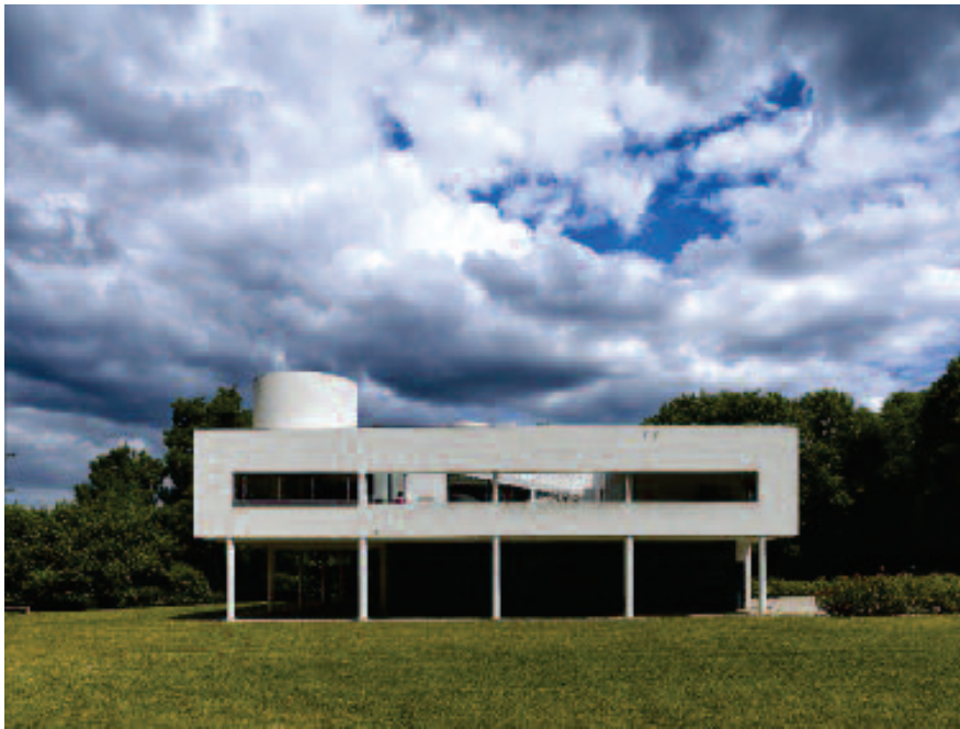
Élément 6 : Villa Savoye - Poissy, France