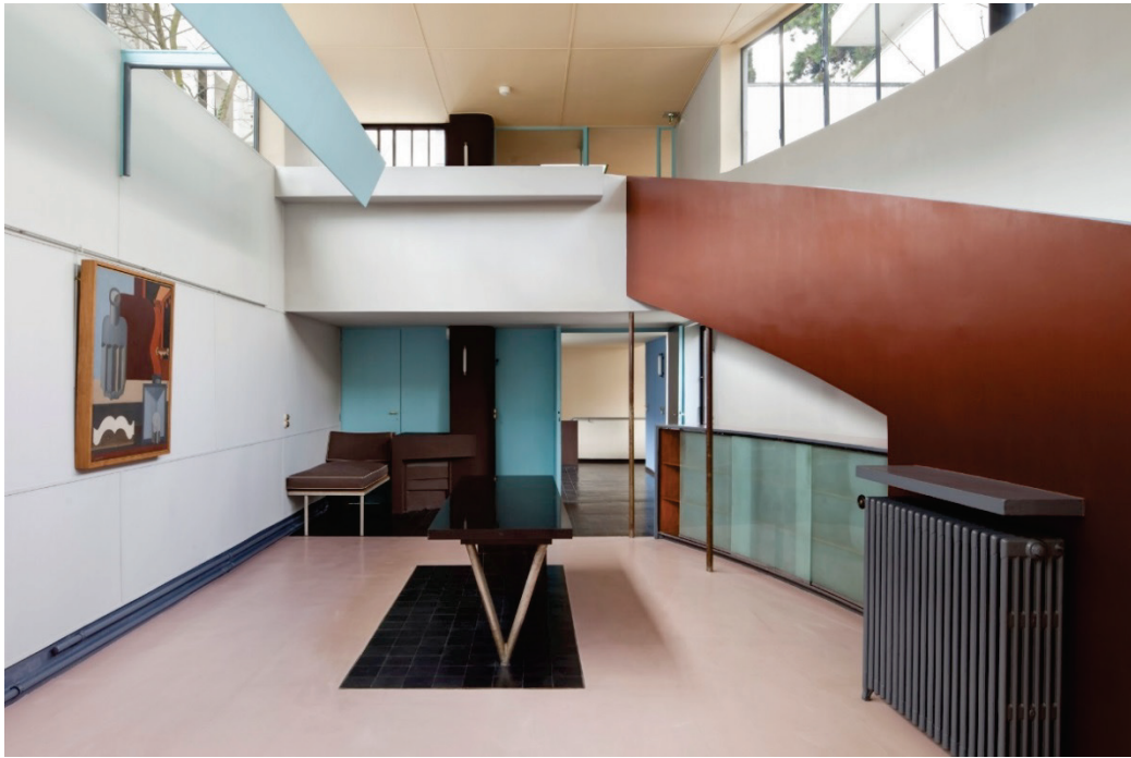
Élément 1 : Maisons La Roche et Jeanneret – Paris, France