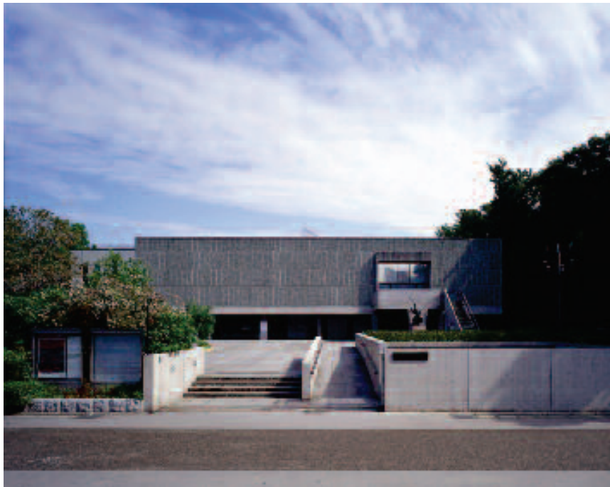
Élément 16 : Musée national des Beaux-arts de l'Occident – Tokyo, Japon