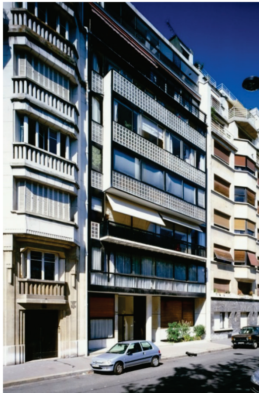
Élément 8 : Immeuble Molitor - Paris, France