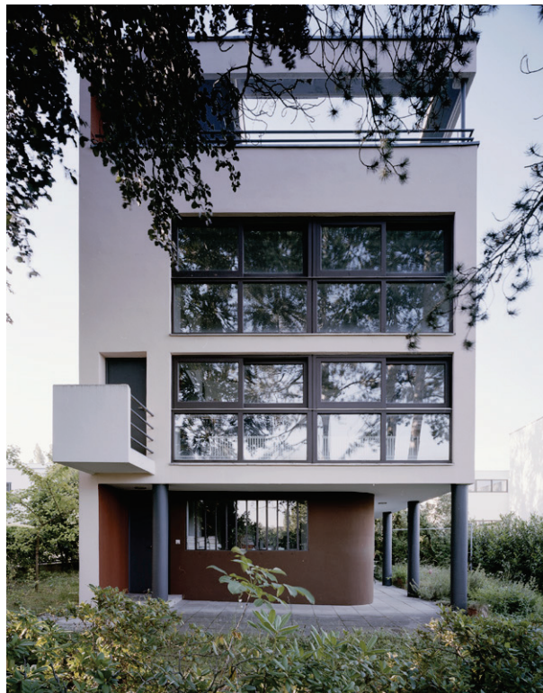
Élément 5 : Maisons de la Weissenhof-Siedlung– Stuttgart, Allemagne