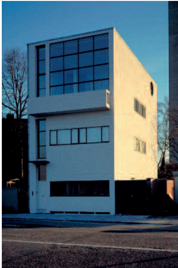
Élément 4 : Maison Guiette – Anvers, Belgique