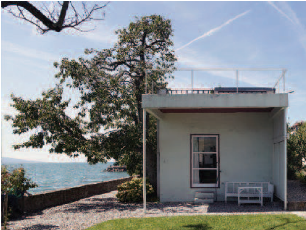
Élément 2 : Petite villa au bord du lac Léman – Corseaux, Suisse