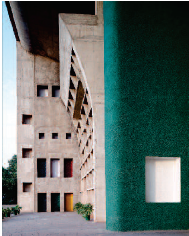
Élément 14 : Complexe du Capitole– Chandigarh, Inde