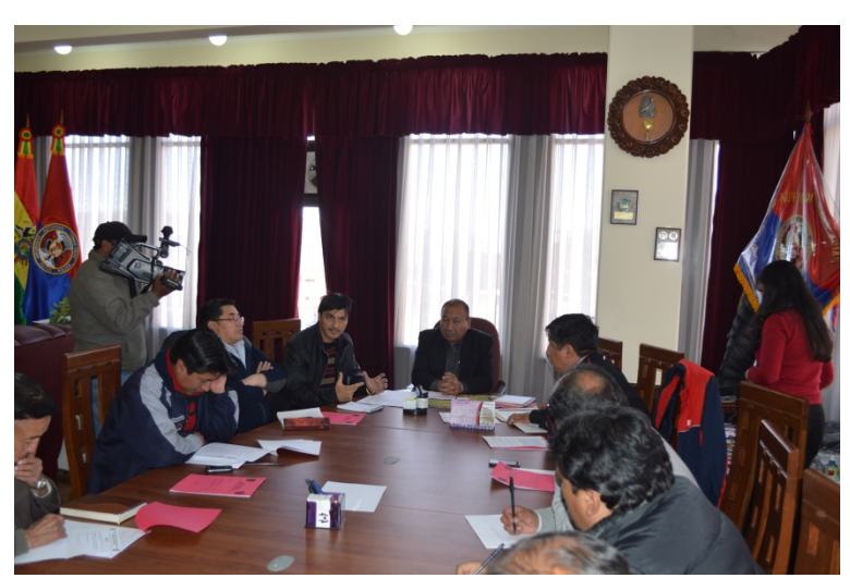
Reuniones Realizadas con el Comité de Patrimonio de Potosí en el Rectorado de la Universidad Autónoma Tomas Frías

The Bolivian government is developing actions to coordinate with the ministries involved in the conservation of the Cerro Rico Mountain (Ministry of the Presidency, Ministry of Mining and Metallurgy, Ministry of Environment and Water and Ministry of Cultures and Tourism), therefore, the multi-ministerial resolution: "Establishment of Management Committee Cerro Rico Mountain" is being elaborated so as the Operational Regulations for it.