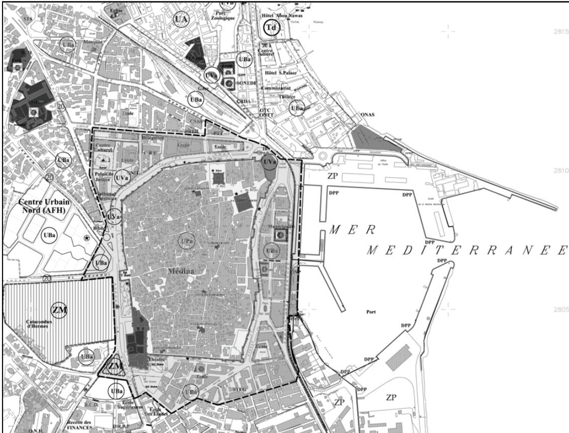
Plan indiquant les délimitations de la zone tampon proposée