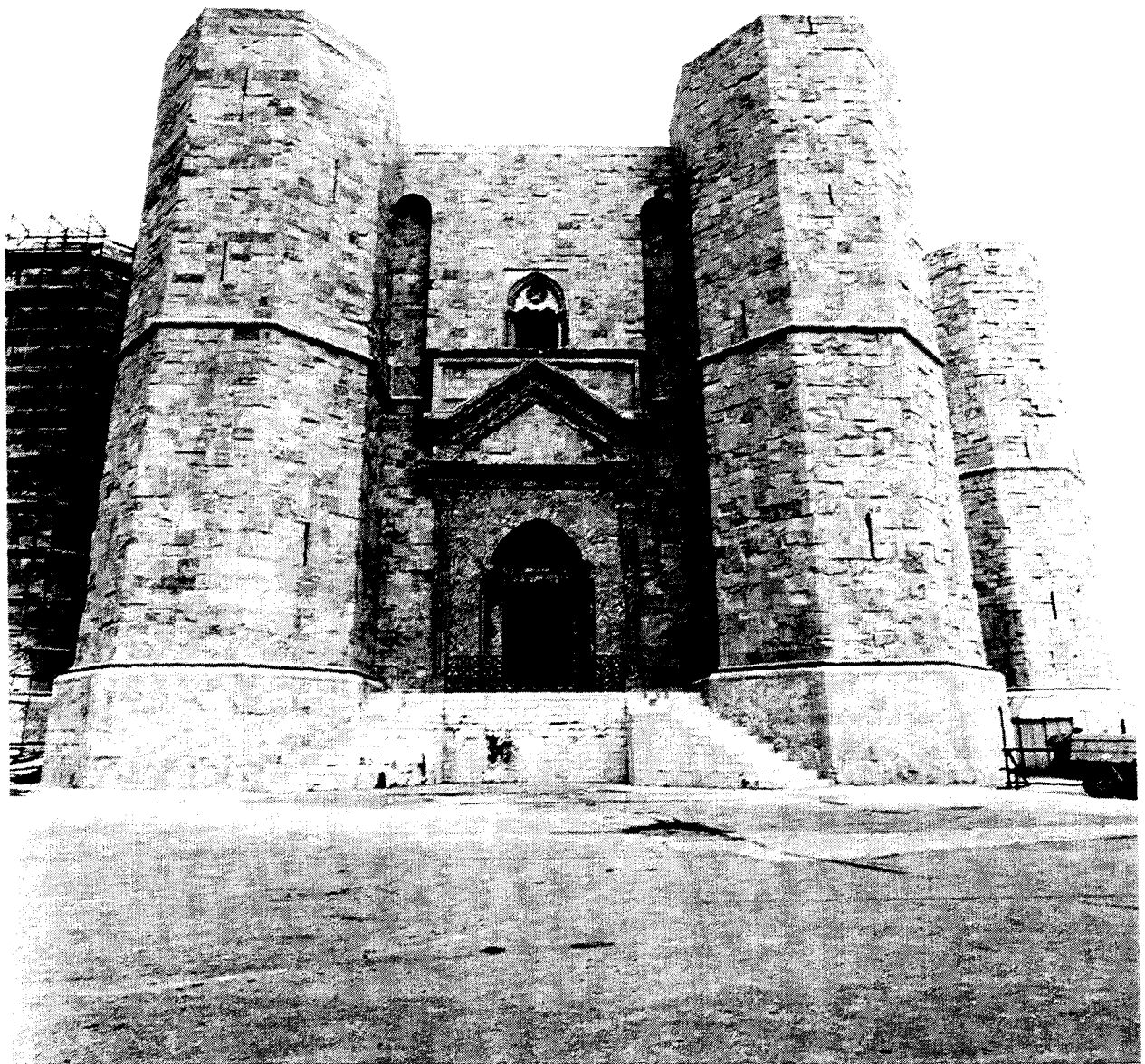
Castel del Monte : façade principale Castel del Monte : main façade