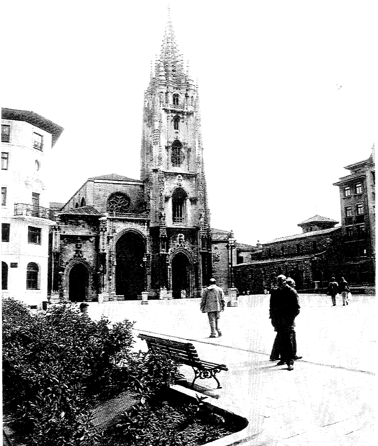
Le centre historique de la cité d'Oviedo / Historical part of the City of Oviedo : Cathédrale du Sauveur, façade ouest / Cathedral of the Saviour, western facade