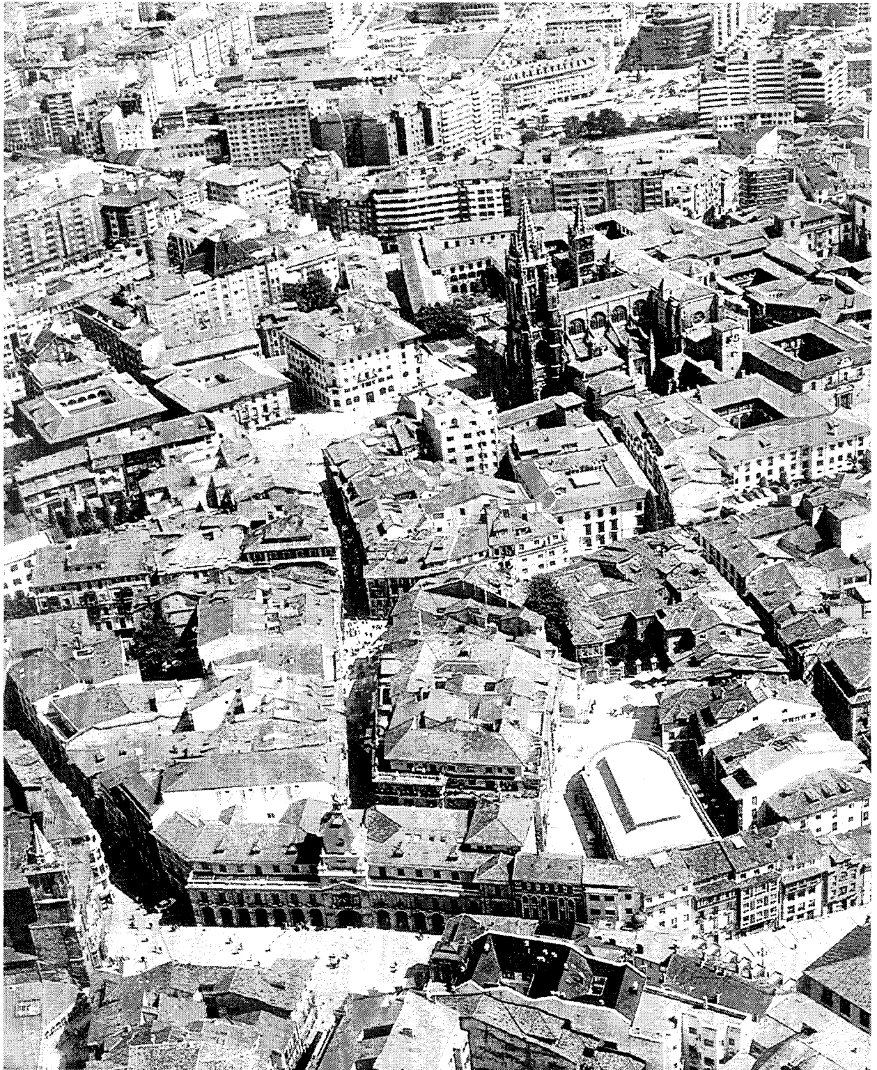
Le centre historique de la cité d'Oviedo / Historical part of the City of Oviedo : Vue aérienne du sud-ouest / Aerial view from south west