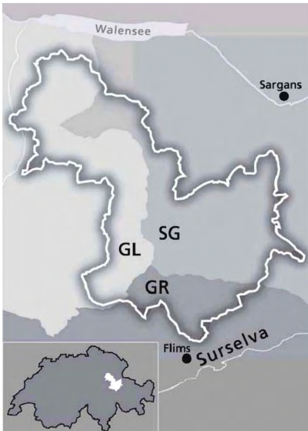
Map 1: Location of the nominated property